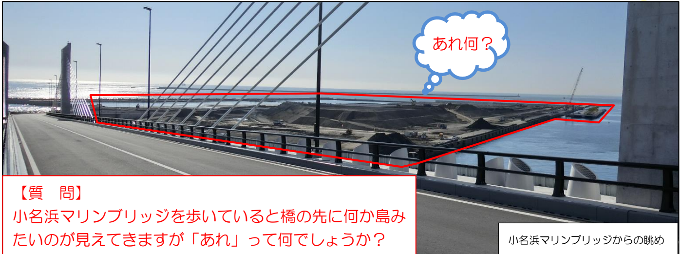
小名浜マリブリッジからの眺め