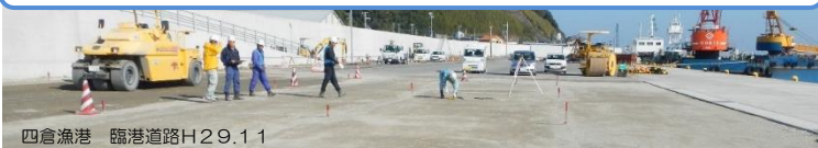
四倉漁港 臨港道路H29.11

豊間漁港（薄磯地区）の人工リーフ、小名浜港の防波堤、四倉漁港の臨港道路等の復旧工事を担当しています。