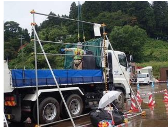
除去土壌等の積み込み作業確認