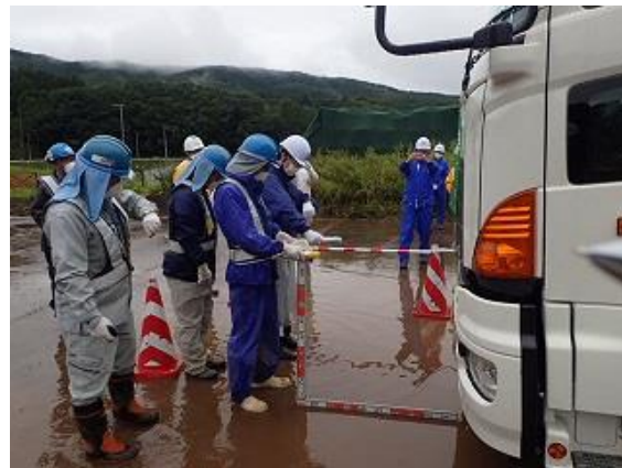
輸送車両の空間線量率測定