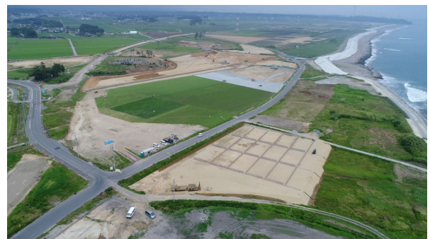
全国植樹祭式典会場

開催日決定の8月9日(水)には、全国植樹祭のPRを兼ねて会津田島駅前など3箇所で開催のチラシ等を利用者の方に配布しました。全国植樹祭の関連行事として、管内13の小学校が平成27年度から継続して取り組んでいる「苗木のスクールステイ」では、ドングリから育てたトチやコナラの苗木約200本、小さな苗から育てたケヤキやイロハモミジの苗木約100本を小学生が育苗しています。「苗木のホームステイ」では、企業や個人の方がクロマツやアカマツの苗木約130本を育苗しています。こうして育てられた苗木は、全国植樹祭の植樹会場や地方植樹祭等で植栽される計画です。