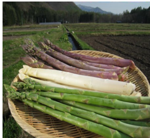
会津田島アスパラ

7月14日(金)、南会津地方で栽培されているアスパラガスが「会津田島アスパラ」として地域団体商標に登録されました。登録は全国で613番目、県内では6番目です。「会津田島アスパラ」は、グリーン、パープル、ホワイト