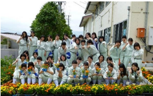
●福島県立磐城農業高等学校