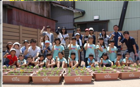
●小名浜地区商店連合会