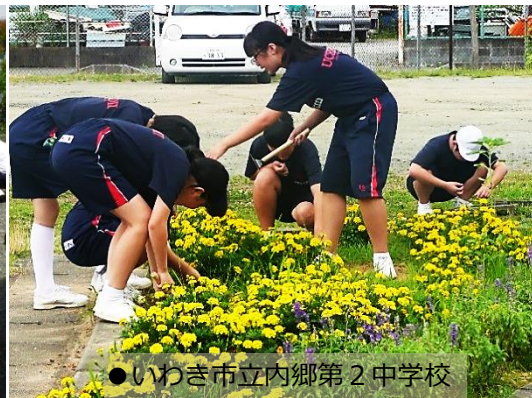
●いわき市立内郷第2中学校