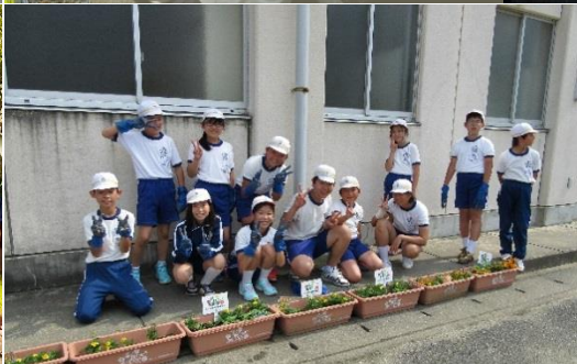
●いわき市立高坂小学校