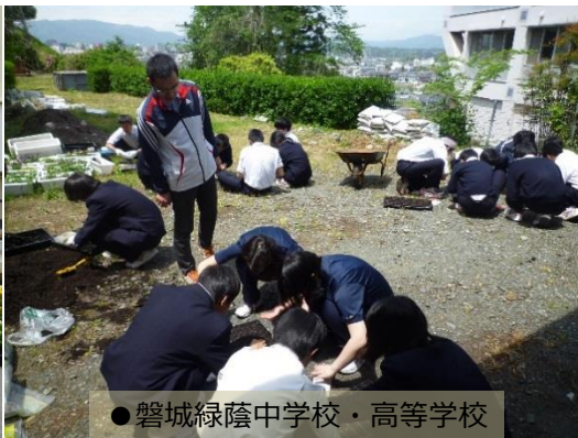
●磐城緑蔭中学校・高等学校