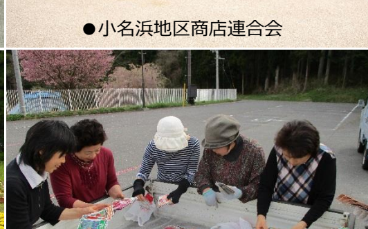
●いわき市川前地区中山間地域集落支援員