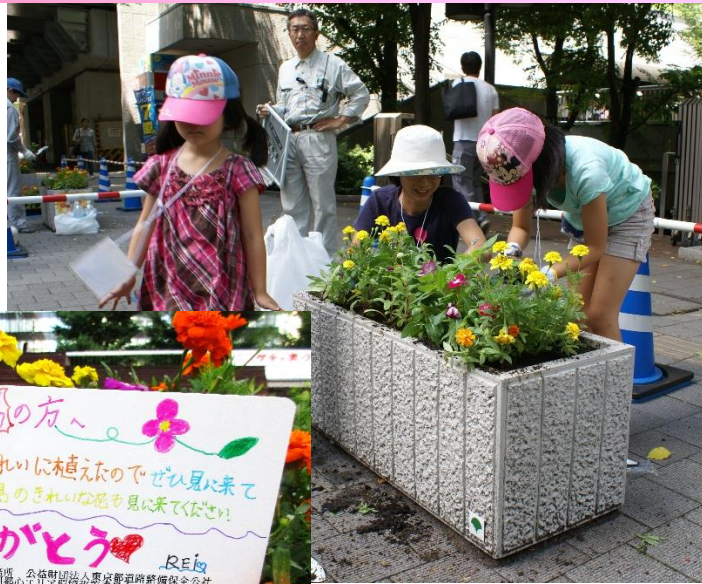
(写真左) 都民が描いた福島へのメッセージ