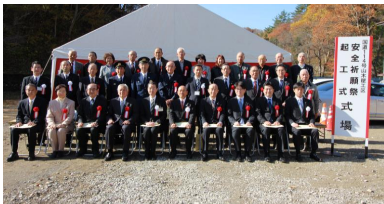
来賓、地元の方々との記念撮影