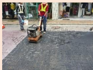
アスファルトに型押し

アスファルト舗装面を加熱し、型を押しつけることで模様を付け、塗料により着色する工法です。良好な走行性を確保しながら、レンガ調の意匠を表現します。