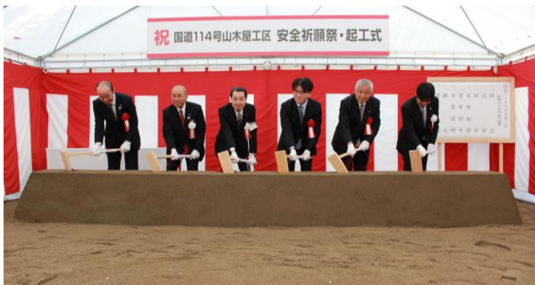
鍬入れする関係者

本事業は「ふくしま復興再生道路」として位置づけており、安全で円滑な交通や定時性の確保、避難解除等地域の復興を支える道路として期待が寄せられており、平成30年代前半の完成を目指し、集中的に整備を進めてまいります。