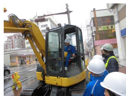
バックホウ体験試乗