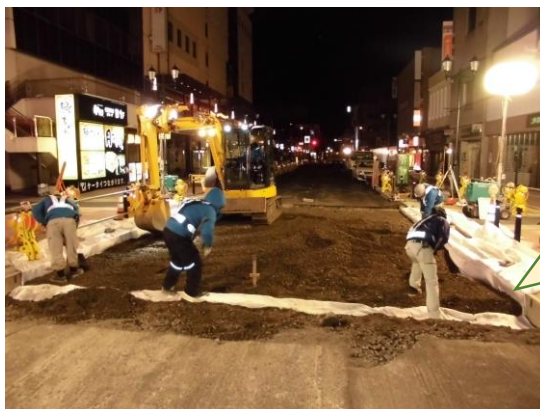
車道の路盤改良工事の状況（12月18日撮影）

夜9時～翌朝5時まで 全面通行止めにしなが ら1日に延長約10mず つ、路盤改良工事を進 めています！