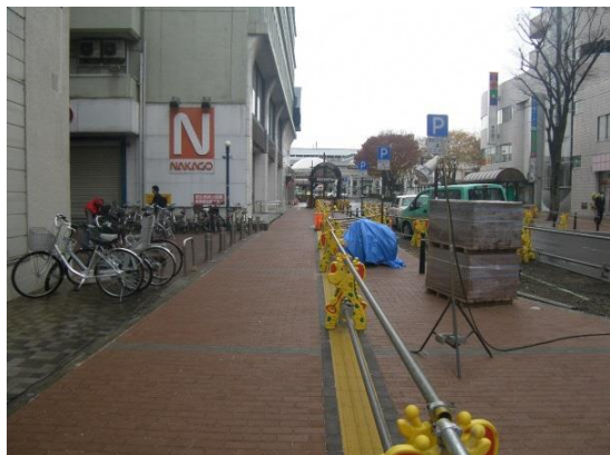
中合前の歩道工事完了（12月1日撮影）

今後はアスファルト舗装、ストリートプリント（型押しアスファルト舗装）を施工し、レンガ調の道路に仕上げていきます。