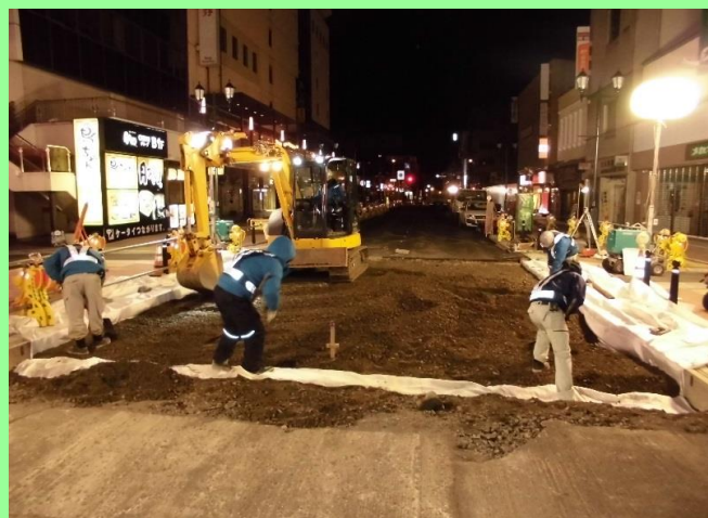
②車道工事施工状況(平成29年12月19日撮影)

車道工事に着手しました。段差等がありますので、車で通行される方はご注意ください。