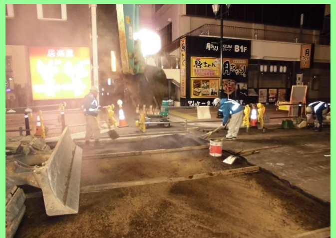
③車道工事施工状況(平成29年12月19日撮影)