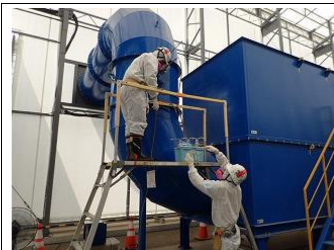
国によるモニタリング実施状況の確認