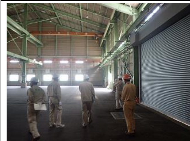
双葉工区内灰の保管場の確認