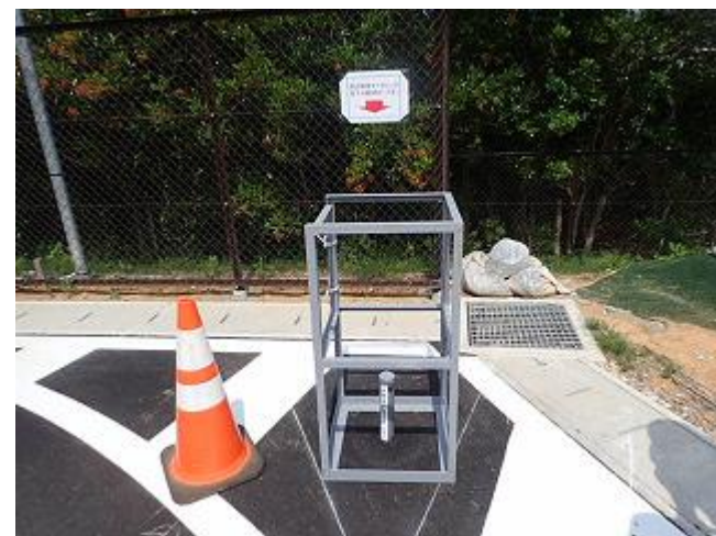
モニタリング井戸の設置状況の確認