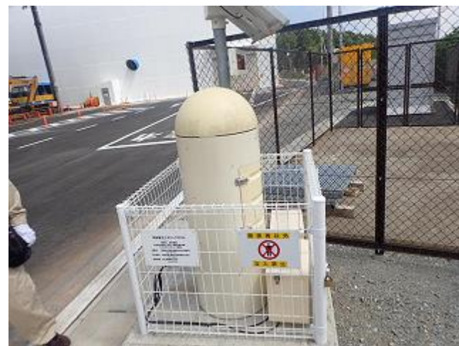
モニタリングポストの設置状況の確認