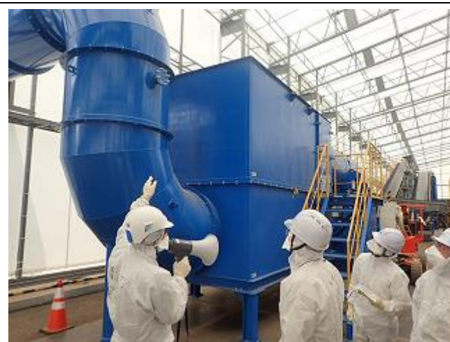
施設内の除じん機の確認