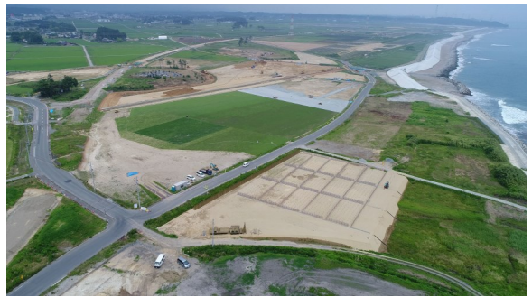
南相馬市雫地区 式典会場(空撮)

昨年11月8日、知事を本部長に「第69回全国植樹祭福島県実施本部」が設置され、本年1月24日には、実施本部第1回班長係長会議が開催されました。本実施本部は、6月10日(日)に開催される「全国植樹祭」の運営を行う組織で8部24班1,440名の県職員が担うこととなります。