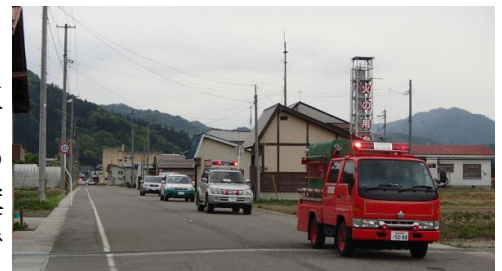
山火事予防呼びかけの様子

毎年4月1日から5月31日までは、南会津地区春の山火事予防運動強化月間です。春は空気