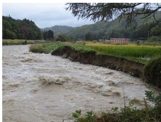
増水した阿賀川と決壊した堤防

今後は円滑な復旧の進捗が図られるよう、関係機関と協働しながら事業を進めていきます。