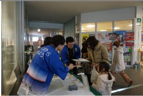
「里山のつづ」PRの様子

2月17日(土)から18日(日)の2日間、福島市の福島県観光物産館(コラッセふくしま1階)において「南会津うまいものフェア」が開催されました。当事務所では、福島県オリジナル新品種米「里山のつづ」のPRブースを出展しました。