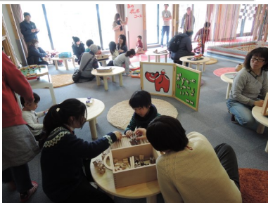
木のおもちゃで遊ぶ親子

南会津町は、今年度から林業成長産業化推進モデル地区に選定され、南会津地域の森林・林業活性化や、地域振興に向けて取り組んでいます。