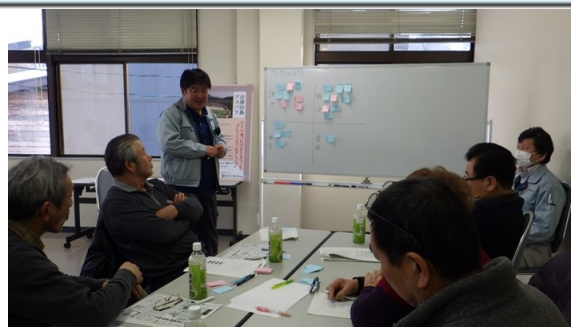
グループに分かれ意見交換を行う様子

平成29年7月に取得した地域団体商標「会津田島アスパラ」をどのように有効活用して今後の販売や産地振興に役立てていくかを検討するため、会津田島アスパラ部会、南会津町、JA、県の職員でワークショップを実施しました。1月31日(水)に第1回を、2月23日(金)に第2回を行い、グループに分かれて意見を出し合いました。第1回はSWOT分析を行い、産地としての強みや弱い部分、産地をとりまく状況としてのチャンスや警戒すべき点などを出し合い、それを踏まえてできる取組みのアイデアを出してもらいました。