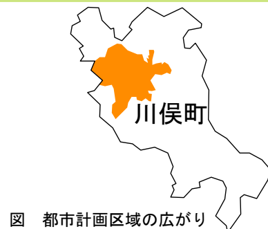
図 都市計画区域の広がり