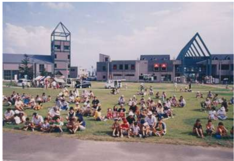
磐梯町イベント風景