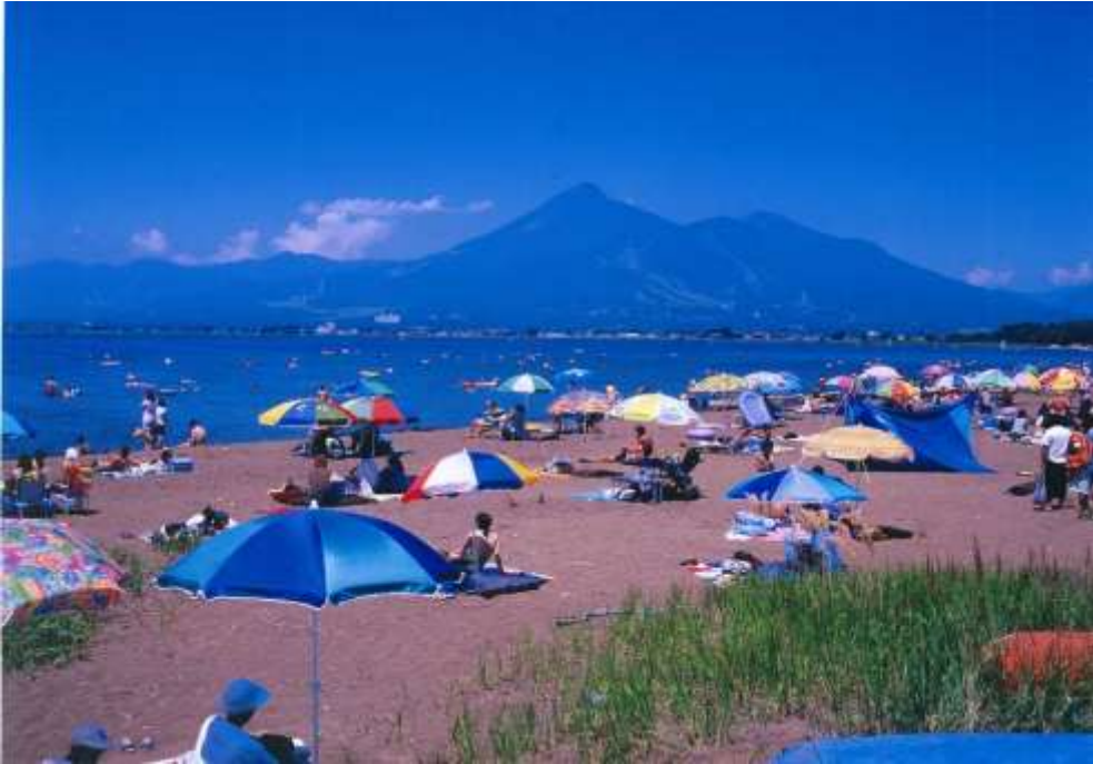
猪苗代湖から磐梯山を望む