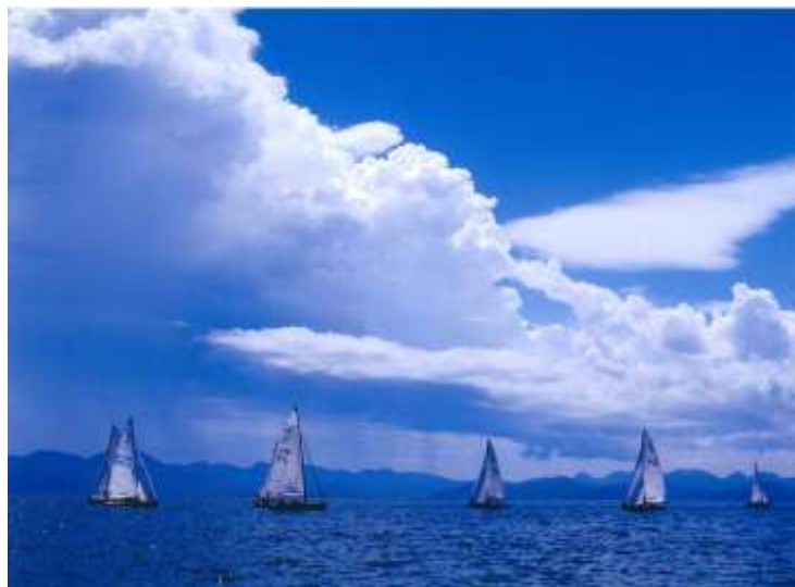
参考 附図3 土地利用方針図

また、用途地域が定められていない区域は、主に良好な居住環境を維持・保全していく区域とする。