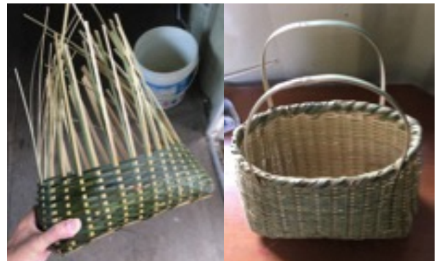
作成した買い物かご