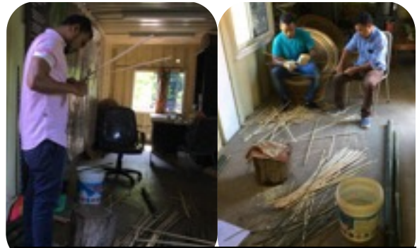
竹割り、剥ぎの様子

同僚と協力して竹を約2mの大きさに切り、節の汚れを取り、水洗いをしました。ノコギリを使って竹を切る作業は、力の必要な作業なので、力自慢の東ティモール人が大好きな作業です。逆に気になったのが、道具の使い方が雑なことです。洗った竹を土足で踏んだり、ナタを土台に打ち付けたりします。置いた場所にも問題があったかもしれませんが、道具を大切にすることも伝えたいと思いました。