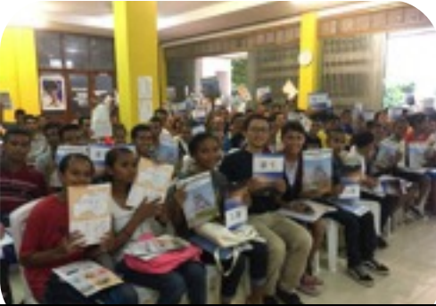
日本語学校で福島県を紹介