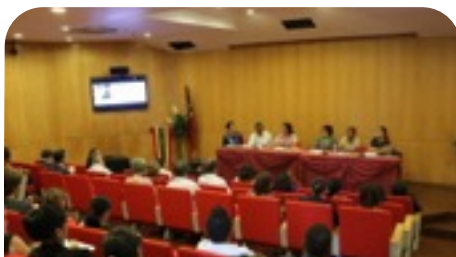
登壇者は政府とNGOの代表者等