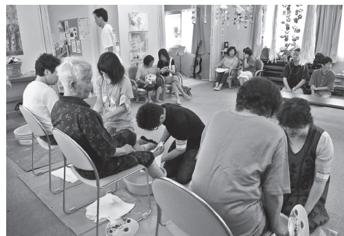
足湯をきっかけにたくさんの方が集まり、コミュニケーションの場となっています。

今まで足湯ボランティア活動を継続して、足湯の役割がとても大きいことを感じています。この活動を今後も継続し、リラックスの場、コミュニケーションの場をつくることによって、利用者さんの今後の生活に少しでもお役にたてれば嬉しいと思います。