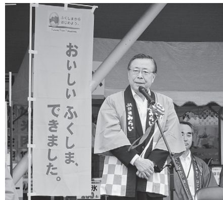
「んめ〜べ」で県産品のPRを行う知事

このため、県内量販店・農産物直売所などにおいて、季節ごとに野菜や果物の消費拡大キャンペーンを実施しています。