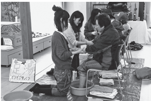
足湯を通して人の温かみを感じています。

郡山市での足湯の活動は、昨年5月16日からビッグパレットで始まりました。昨年の9月、避難所から仮設へ活動を移し、仮設集会所をお借りして足湯を行うようになりました。現在は、郡山市内の仮設住宅を月2、3回のペースで回って活動に取り組んでいます。