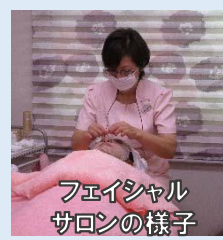
フェイシャルサロンの様子