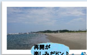
再開が楽しみだドン♪

平成30年7月21日に東日本大震災以来、8年ぶりに原釜尾浜海水浴場が再開されます。「相馬福島道路」の延伸により、たくさんの来場者が訪れることが期待されています。