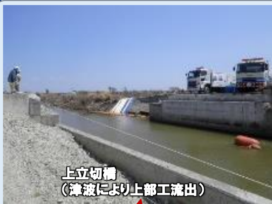
上立切橋 (津波により上部工流出)

このため、新しい道路は、ほ場や海岸防災林の整備計画を踏まえ、最大500m程度内陸側を通るルートとし、高さは約2mの盛土構造としました。残る区間についても引き続き、工事を進めてまいります。