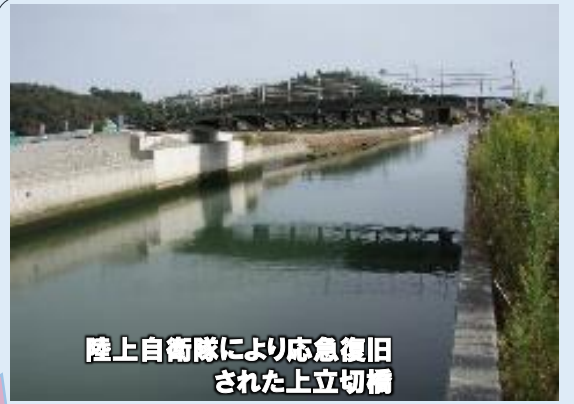
陸上自衛隊により応急復旧された上立切橋