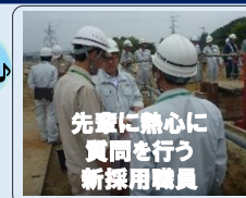
先輩に熱心に質問を行う新採用職員