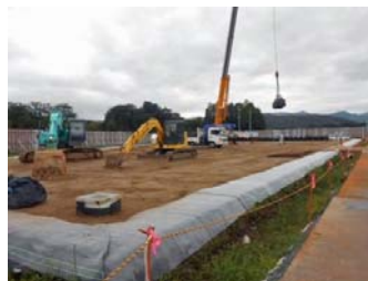
仮置場造成・搬入状況