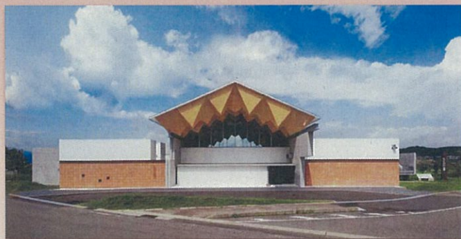
◆第34回建築文化賞 準賞 宮畑遺跡史跡公園 体験学習施設(じょいもん)…福島市

平成30年12月中に次の各賞を発表します。 福島県建築文化賞(1点)、準賞(1点)、優秀賞(若干)、特別部門賞(若干) 復興賞(若干)