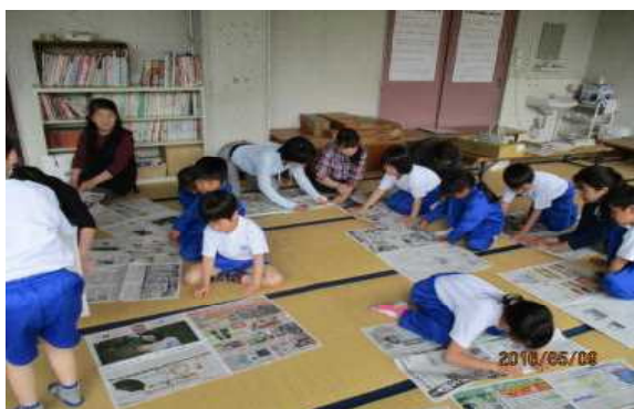
みんな一生懸命に取り組んでいます

今回は「新聞エコバッグづくり」。昨年度あらかい子ども教室でもやらせていただいた活動ですが、そこでは時間が足りず、最後まで完成させることができなかった子どももいたので、今回はその反省点を生かし、バッグの取っ手となる部分は、予めこちらで準備しておきました。するとそこに参加していた子どもたち全員がバッグを完成させることができ、みんな大満足の表情。保護者の方々、指導員の皆様方の御協力もあり、大成功に終わることができました。是非お家でもチャレンジしてみてください。