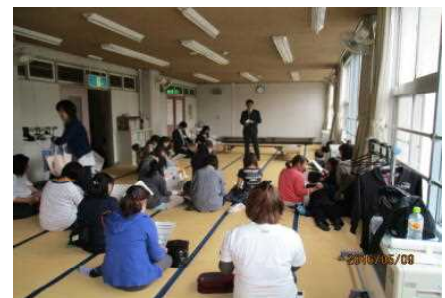
説明に聞き入る保護者の皆様

開講式を前に、保護者の方々がお集まりくださり、まずは保護者向けに「放課後子ども教室とは」「子どもたちに望むこと」「お家の方に望むこと」などを私どもの方からお話しさせていただきました。それから江里子さんから「たじま子ども教室での活動内容」や「注意事項」などを