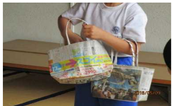
上手にできました