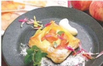
家で食べる時はあたたかため生クリームを添えるのがお洒落

●メニュー ももふるホットパイ 350円(税込) *家で食べる方* トースター3分または電子レンジ30秒 ●住所 福島市田沢甲木曾内町6-8 ●電話 024-547-3888 ●営業時間 10:00-17:00 ●定休日 土日祝 ●駐車場 有