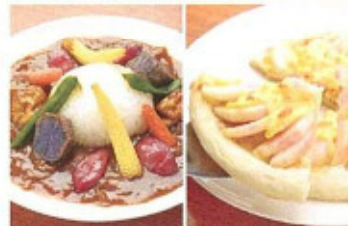
店内にフィン系桃がもう 焼き上がりに桃ソースをかけて

●メニュー 桃ピザ 800円(税込) ももカレー 800円(税込) ●住所 福島市飯坂町平野前27-3 ●電話 024-541-4465 ●営業時間 10:00-15:00 ●定休日 無休 ●駐車場 有