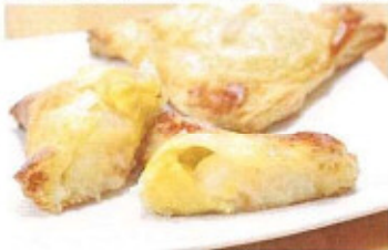
あたたかいと桃のトロツと感が引き立ち、まるで桃クリーム

●メニュー Hot桃パイ 200円(税込) *家で食べる方* トースターで2~3分温める ●住所 伊達市梁川町字中町30-2 ●電話 024-577-6626 ●営業時間 8:00-19:00 ●定休日 火曜日 ●駐車場 有