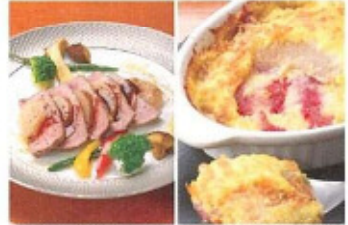
エゴマ香と桃は抜群コンビ スイーツ感覚の白桃グラタン

●メニュー 白桃のザッパイクォースグラタン 780円(税込) エゴマ香と桃のピザ 1380円(税込) *ディナータイムのみ(ランチ時は要予約) ●住所 福島市栄町6-4/セカンドビル2F ●電話 024-523-5510 ●営業時間 18:00-22:00 ●定休日 火曜日 ●駐車場 無