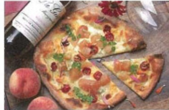
桃の生地に桃とチーズ、トマトの酸味がフィンをピタリ

●メニュー 桃と自家製リコッタチーズのピザ 1250円(税込) *ディナータイムのみ* ●住所 福島市栄町3-5 栄町清水ビル2階 ●電話 024-521-2342 ●営業時間 11:30-14:00, 18:00-22:00 ●定休日 火曜日 ●駐車場 無