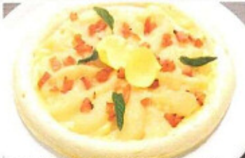
直径20cmのピザはシェアするのにちょうどいいサイズ

●メニュー 桃ピザ 780円(税込) ドリンク付き 870円(税込) ●住所 伊達郡国見町藤田字日蓮二18-1 ●電話 024-585-2132 ●営業時間 10:00~17:00(LO16:30) ●定休日 無休 ●駐車場 有