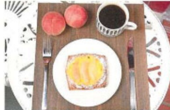
一人で食べるにはもったいない!7お土産にもピッタリ

●メニュー 福島県産桃とカスタードのデニッシュ 280円(税込) *1日20食限定(福島県産桃でも販売あり)* ●住所 福島市水町6-22/フリア大町ビル1F ●電話 024-503-9161 ●営業時間 9:00-20:00(酒類は20時閉店) ●定休日 無休 ●駐車場 無