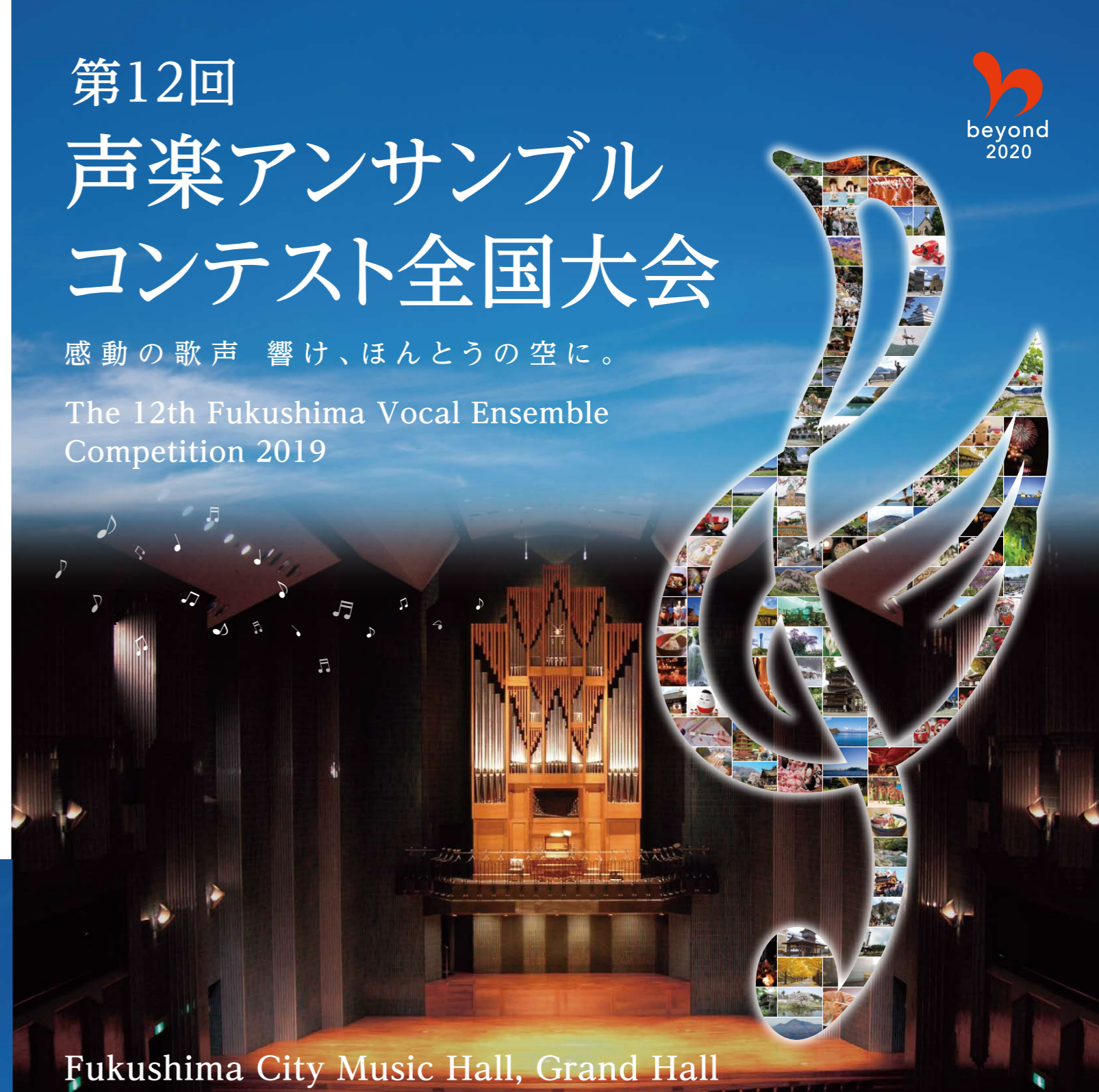
Fukushima City Music Hall, Grand Hall

The 12th Fukushima Vocal Ensemble Competition 2019