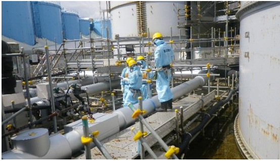
(写真 2 - 1) 排水操作後の配管系統の確認状況