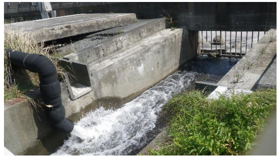
(写真 2 - 2) 地下水バイパス排水口の状況