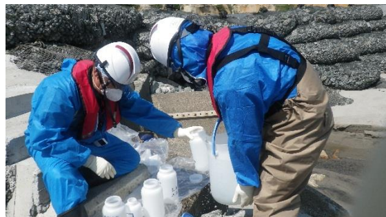
(写真 5 - 2)

5 プラント関連パラメータ等の確認 各パラメータについて、前日と比べ有意な変動は確認されなかった。