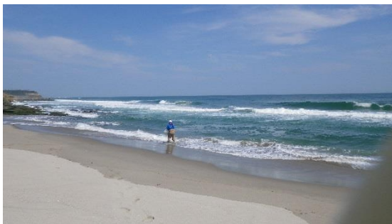
(写真 5 - 1)

(4) サブドレン処理水排水に伴う海水サンプリング状況について サブドレン処理水排水に伴う海水の検体サンプリングに立ち会い、5・6号機放水口北側の海岸において、定められた手順によりサンプリングが行われていることを確認した。地下水バイパス排水に伴う海水サンプリングと同様に、東京電力が分析を行う検体とともに県が分析を行う検体が採取された。(写真 5)