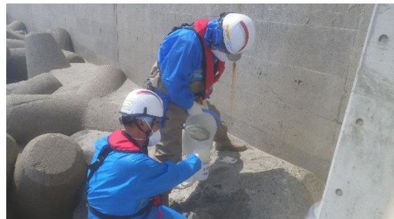
(写真 3 - 2)