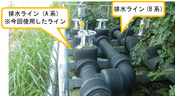
(写真 4 - 1) サブドレン処理水排水系路のバルブユニット) の状況