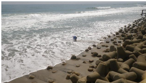
(写真 3 - 1)