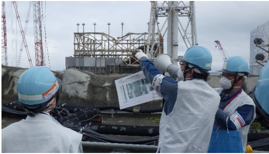
(写真1) 1号機原子炉建屋上部、 1・2号機排気筒