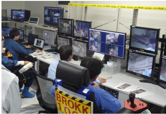
(写真3) 2号機遠隔操作室