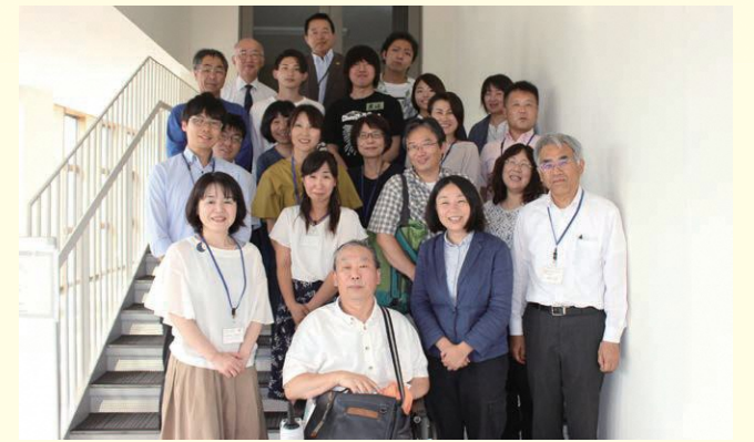
「官民協働でつなげる広域避難支援」を考えるシンポジウムの参加者の皆さんと

「ふうあいおたより」の発行(3回/年)、交流会の企画・運営・広報のお手伝い、悩みごとの相談(よろず相談)などを中心に活動しています。