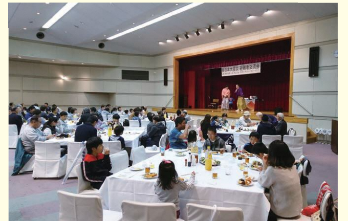
昨年の全県避難者交流会の様子

①官民40団体が協働しワンストップでの「日常の相談対応」、②全県避難者交流会や地域別交流サロンの開催および、各種団体からの招待イベント情報の告知と参加促進による「交流機会の提供と孤立防止」、③時間の経過や子供の成長などにより変化していく支援ニーズを把握するための「アンケート調査の実施」を通じ、避難者の皆様への継続的な生活再建支援に取り組んでいます。今年度の全県避難者交流会は10月21日(日)に開催します。