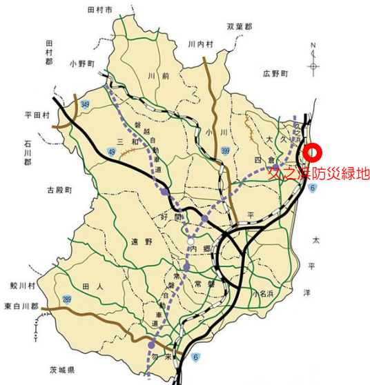
— 久之浜防災緑地の位置 —

あの大震災から7年と8ヶ月。防災緑地と防潮堤に囲まれた久之浜町では、そこに住む私たちの安心を継続的に得るため、防災緑地を適切に維持管理しなければならぬと思います。自助と共助によって住民が協力し、安全のために防災緑地を保全し後世に引き継ぐ事が理想と考えます。それが安心して生活できる地域である条件だと私は思います。しかし、今後少子高齢化時代を考えると防災緑地の維持管理の担い手の確保など課題が山積みですが、何か対策はあるはず。私は思います。防災緑地は住民のもの。安心して生活できるようみんなで守っていくもの。