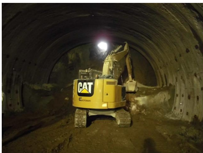
浪江町側抗口での貫通時の状況 (平成30年11月6日撮影)

今後はトンネル内部の工事を進めていきます。なお、国道114号 山木屋工区については、平成30年代前半の供用開始を目指し整備を進めてまいりますので、ご理解とご協力をよろしくお願いいたします。