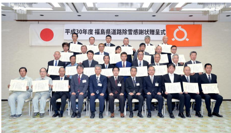
感謝状贈呈式での記念撮影の様子

今年度は、過去5年間連続して除雪業務に従事し、企業より推薦を受けた29名に感謝状を贈呈しました。