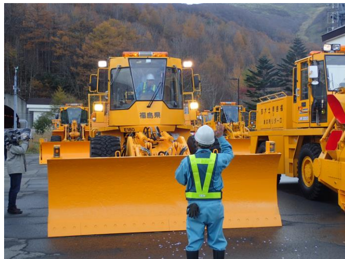
除雪機械の出動前に異常が無い点検を実施しました。