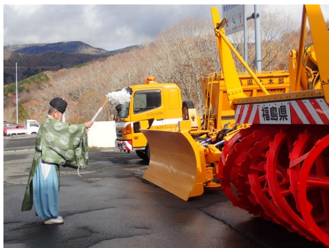
除雪期間中の「無事故・無災害」を祈願しました。

除雪作業については、道路を運転中の皆さまにもご迷惑をお掛けしますが、冬期間の安全を確保するため、今後とも作業へのご協力をお願いいたします。