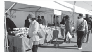
▲大堀相馬焼大せとまつり

来場された方は、懐かしい顔に会い、話を弾ませるなど、浪江伝統の祭を楽しみました。