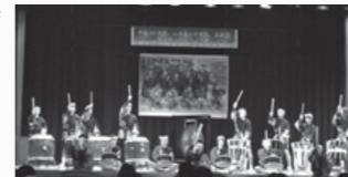
▲全校生による和太鼓演奏

午後は、地域の方々とグラウンドゴルフとスポーツ吹き矢を楽しみ、地域と笑顔あふれる時間を過ごしました。