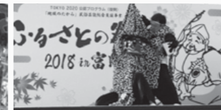
▲ふるさとの祭り2018in富岡