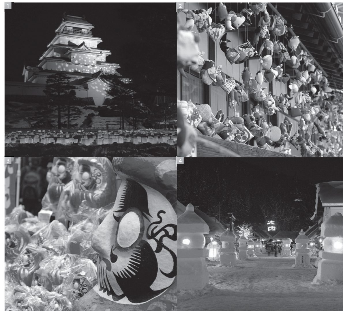
1 鶴ヶ城絵ろうそくまつり(会津若松市) 2 つるし雛(いわき市) 3 白河だるま市(白河市) 4 大内宿雪祭り(下郷町)

「ふくしまの今が分かる新聞」では、県内外に避難されている皆さまや被災者・避難者支援に携わる多くの方々へ、避難者支援の取り組みや福島の復興に向けた動きなど「ふくしまの今」が分かる情報をお届けします。