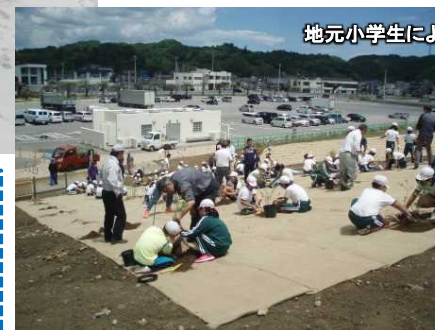
地元小学生による植樹状況(6/1)

海岸堤防の嵩上げ、防災緑地など複数の手法を組み合わせた「多重防御」が完成しました。地域の方々と協力して植樹した木々が緑豊かで安心を与える施設として活用が期待されます。