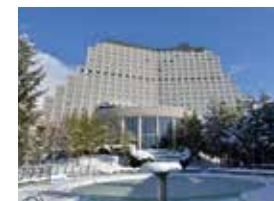
ひときわ目立つホテルリステル猪苗代のウィングタワー