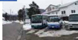
磐梯山温泉ホテルとアルツ磐梯