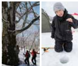
裏磐梯はほとんどが国立公園内、色濃く大自然の中で学べる。