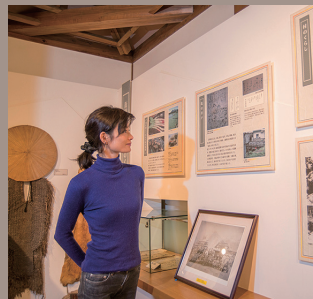
歴史館には、北塩原村における塩づくりの歴史に関する資料も。