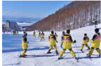
ゲレンデデビューにピッタリの広々緩斜面。