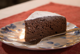
「会津山塩」を使った人気のチョコレートケーキ「ガトー塩ッコラ」

塩スイーツで ほっこりティータイム 塩は、食事だけでなくスイーツづくりでも活躍します。裏磐梯の人気スイーツ店「ヒロのお菓子屋さん」では、「会津山塩」を使ったスイーツも製造しています。チョコレートをつくり使った