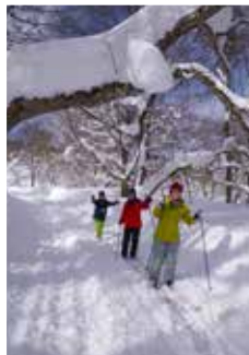
初心者の方には、ガイドも用意可(有料)