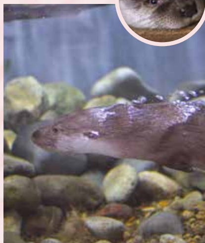
カワワノの生態を間近で観察

「カワワノのふち」では、絶滅宣言されたニホンカワワノに遺伝的に近い、ユーラシアカワワノを展示。午前10時頃と午後3時頃の給餌時間には、活発に泳ぐ姿が見られ、とても人気です。