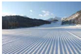
雄大な磐梯山の雪景色!

スキーのメッカ・磐梯山の裏側に位置し、全体の4割が200m幅のワイドな緩斜面、安全にスキーレッスンや体験プログラムもできるスペースも十分です。なんといっても平日貸しきり可能なスキー場です。