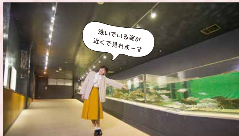
日本列島サケ・マス類のショーウィンドウ。