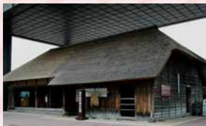
英世が16歳まで暮らしていた生家。

所在地 / 福島県耶麻郡猪苗代町大字三つ和字前田 81 営業時間 / 4月～10月 9:00～17:30 入館は17:00 11月～3月 9:00～16:30 入館は16:00まで 料金 / 入館料: 一般 600円、小中学生 300円 ※未就学児無料 駐車場 / 220台 無料 お問い合わせ / TEL.0242-65-2319