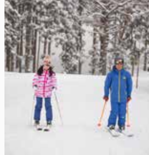
インストラクターと一緒に滑り技術を習得。「できる」が自信につながります。