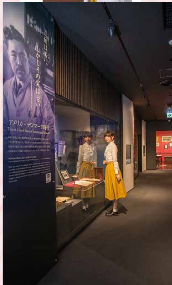
野口英世の生涯を時代ごとに分けて展示。