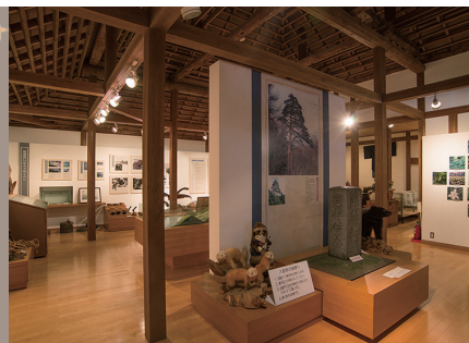
併設の「会津・米澤街道榎原歴史館」には周辺地域の歴史資料が展示されている。