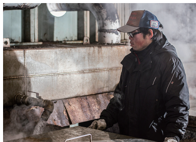
塩分濃度の薄い温泉水を数日かけて煮詰めて濃縮していく。 目の離せない作業。

江戸時代には年間8000俵も 生産され、年貢として会津藩に納め られ会津地方に賑わいをもたら し、明治時代には菱の紋に模られた 塩が皇室に献上されるほど珍重さ れていました。しかしながら、時代の 変化とともに外部の塩が流入する ようになり、会津裏磐梯での塩づく りは昭和23年に一旦終焉を迎える こととなります。