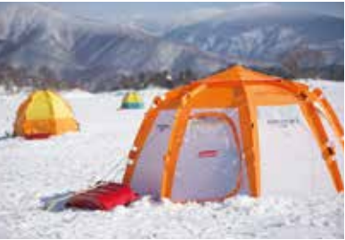
湖上にはワカサギ釣りを楽しむ人のテントがたくさん。