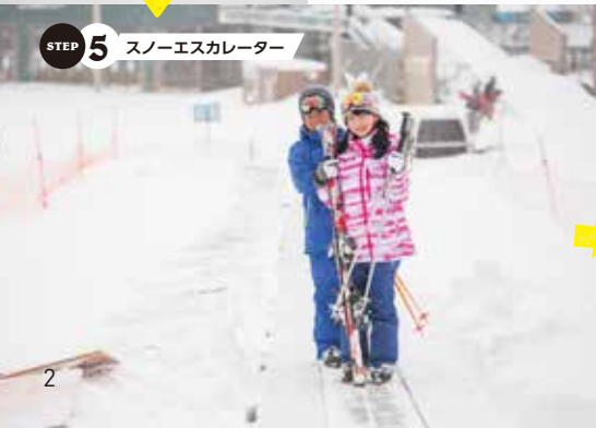
STEP 5 スノーエスカレーター