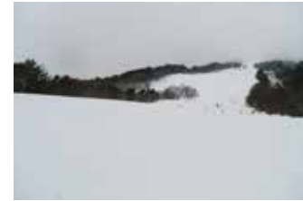
幅の広い緩やかな斜面は初心者におススメ!

猪苗代スキー場はレベルに合わせた2大エリアで、楽しく伸びやかにレッスンが出来ます。中央エリアは幅の広い緩斜面が多く、初心者におすすめのゲレンデです。磐梯山と猪苗代湖の自然の中で楽しい思い出づくりを!