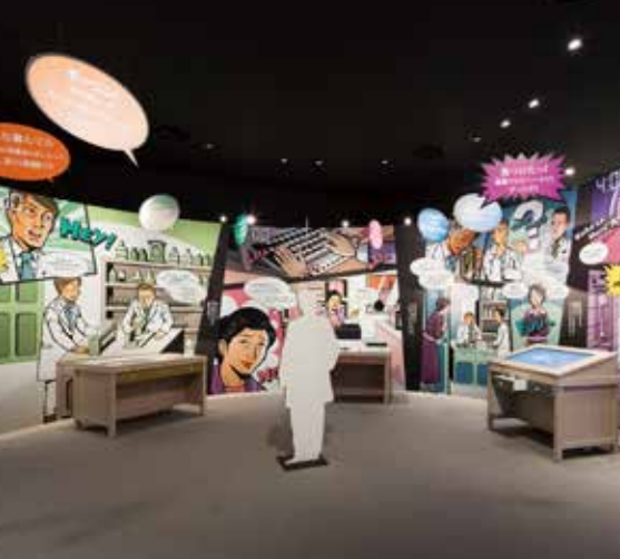
英世そっくりのロボットが質問に答えます(上) POPに表現された研究の世界(下)