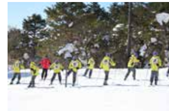
スキー学習初日のレッスン風景。

初心者(学生団体含む)の方々に安全第一、親切丁寧な指導でスキーを楽しんで頂きます。服装、用具の確認、初めは雪に慣れることからスタートし滑る感覚を徐々に覚えていきます。ある程度のコントロールができればインストラクターの後について滑走いたします。