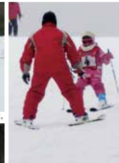
生徒さん1人1人にしっかり声掛けし、安心してレッスンに望んで頂けます。