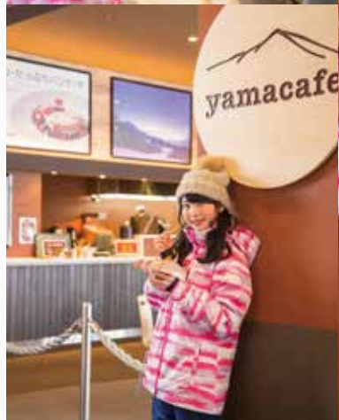
おやつタイムはYama cafeへ。スイーツでほっとひと息。