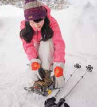
スノーシューやストックなど装備品はレンタル可能。足の先をベルトで固定します。