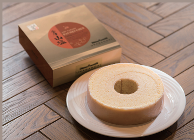
「会津山塩」を使ったバウムクーヘン。伝統菓子の老舗「かんのや」とのコラボレーション。さっぱりした甘さであとをひくおいしさ。

「ケーキ」「ガトー塩ッコラ」は、チョコレートに甘さを塩のしよぼさが引き締め、あっさりとした甘さで何個でも食べられそう。また、こまに詰り固めのスティック状に焼き上げた「こま塩棒」は、ほどこよい塩ついで、ちよと小腹が空いた時にもおすすすめ。店内には「会津山塩認定」の木札も飾つてあるので、ぜひ探してみてください。