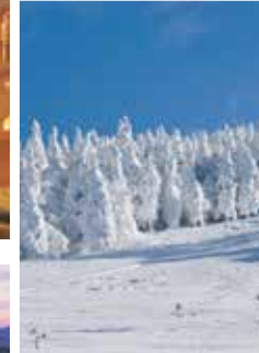
1月~2月下旬は樹氷も見れます。