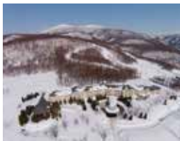
裏磐梯グランドホテルもグランドコスノーリゾートの目の前