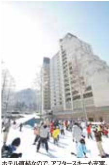
ホテル直結なので、アフタースキーも充実。