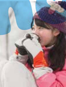
森の中のティータイムは至福のひとつ。