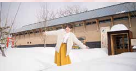
震災にも耐えた、大きな酒蔵を改装。第33回福島県建築文化賞 正賞受賞。