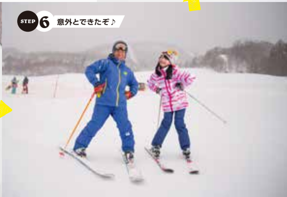
STEP 6 意外とできたぞ!