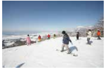
ゲレンデから望む大迫力の絶景パノラマ!

猪苗代湖と磐梯山を一望できる唯一のスキーリゾート!ホテル直結のバリエーション豊富なゲレンデはキッズから上級者まで楽しめます。スキーやスノーボードの各種レッスン(予約制)もあるので初心者でも安心です。