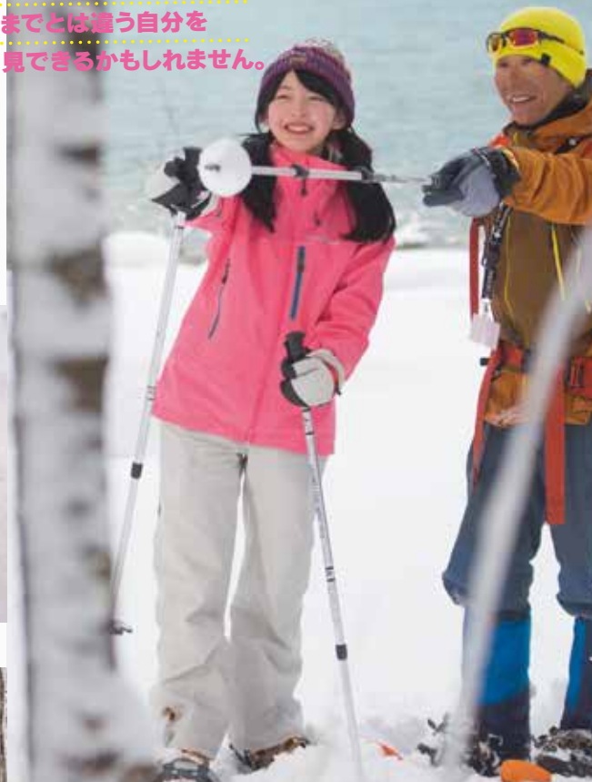
雪の上には動物たちの足跡を見かけることも。

冬にしか見られない造形美が待っています スノーシューは西洋式のかんじき。フワフワの雪も忍者のように歩けます。夏には踏み込むことのできない木々が生い茂る道も、雪が積もればスノーシューでラクラク。特別な技術や体力を必要としないので、未経験者やお子さんでも大丈夫。裏磐梯もくもく自然塾では会津磐梯山エリアの魅力を紹介するスノーシューツアーを毎日開催。厳冬の滝や純白の森などをめぐるコースを案内しています。公益社団法人日本山岳ガイド協会(JMGA)の認定登山ガイドが同行します。