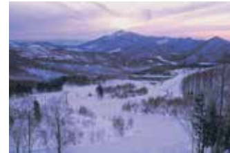
ゲレンデ目の前に広がるホテルです。