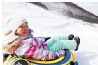
ニャンダーマウンテンで滑れなくても満足。