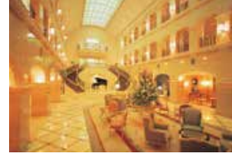
2F 3Fは半分が吹き抜け、男女別フロアも可。

標高1000m~1500mのゲレンデは11月下旬から4月中旬までの長い営業期間が魅力です。12月~2月はパウダースノーで上達も早いです。ホテル・ブルミエール箕輪は全て洋室の95室。150名から貸切可能で、最大280名宿泊できます。ご希望で貸切ナイター営業もいたします。