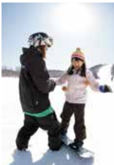
丁寧なレッスンで上達をサポート。