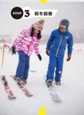
STEP 3 板を装着