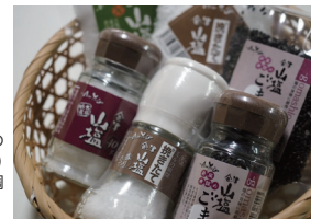
「会津山塩」は粒の小粒と大粒(ミル用)の2種類。ほかに調味塩もある。