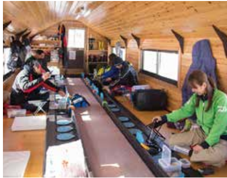
隣の人や向かい側の人とおしゃべりしながら釣れるのは、ドーム船の楽しさのひとつ。

※遊漁料日釣券は、各施設のほか、磐梯湖のコンビニ、曹多方市山形方面からお越しの場合は大塩地区の鈴木養酒場でもお買い求めいただけます。