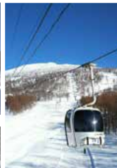
ゲレンデデビューはゴンドラに乗って。