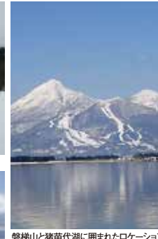
磐梯山と猪苗代湖に囲まれたロケーション!