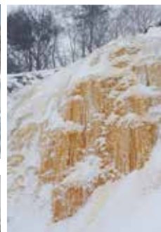
名物イエローフォール!