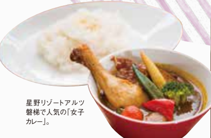
星野リゾートアルツ磐梯で人気の「女子カレー」。