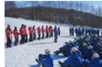
ゲレンデで開校式・閉校式を行います。