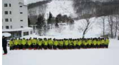
ホテルの玄関を出れば目の前がゲレンデ。

ホテルを出ると目の前がゲレンデ。350mのペアリフト1本ではありますが、宿泊者には専用ゲレンデとして、またスキー教育学習などでは貸切利用で安全安心に楽しめるゲレンデとして好評です。スキーの後には全浴槽源泉かけ流しの温泉で身体の芯からほかほかに。