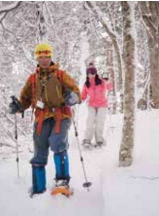
歩き方のレクチャーを受け、冬の五色沼へ。