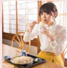
美術館のお隣は 手打ち蕎麦のお店。会津特有の辛 味大根を使用した 蕎麦も味わえます。