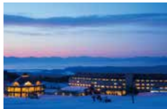
隣接のホテルで宿泊もサポート。