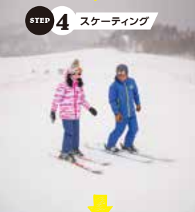
STEP 4 スケーティング