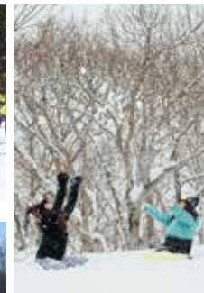
雪質の良さは上達の鍵。