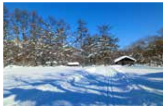
圧雪車でコース整備。快適に滑走できます。