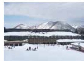
ホテルブルミエール箕輪もオン・ザ・グレンデ