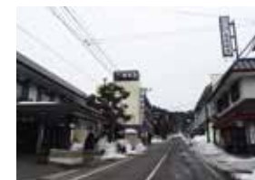
情緒ある中ノ沢温泉街。通り沿いに温泉旅館がならぶ。