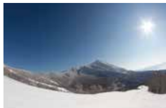
磐梯山を臨むロケーションも抜群。

全29コース、南東北最大級のゲレンデを有し幅広いレベルのレッスンに対応できます。スノーエスカレーターも完備。また星野リゾート 磐梯山温泉ホテルが併設されており、宿泊・食事まで幅広くサポートされています。