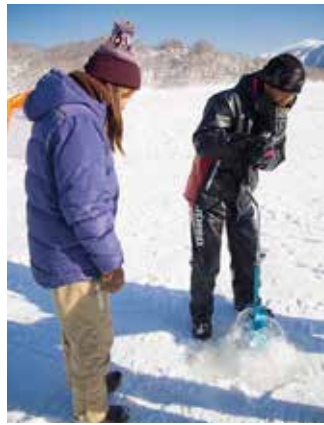
厚い氷が張った湖にドリルで穴を開けます。