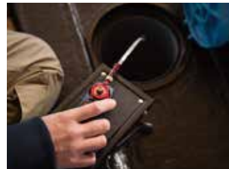
蓋を開けて糸を垂らすだけという手軽さ。