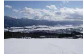
ゲレンデ中腹からのロングクルージング!