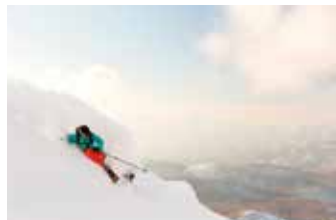
上質な粉雪は初心者も滑りやすい。

マイクロファインスノーと北斜面、上達を目指すためのゲレンデ! 裏磐梯特有の気候と地形がもたらす驚くほど軽い雪が魅力です。優しい雪が上達を後押し。豊富な雪で12月からGWまでの長期間の営業が可能です。滑らずとも楽しめる「ニャンダーマウンテン」でのアクティビティも楽しいですよ。