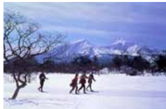
会津磐梯山を望むクロスカントリーコース。

休暇村裏磐梯本館に隣接するスキーコース。クロスカントリースキーコースは起伏も少なく整備されているので、初めての方も安心です。コース内至るところに動物の足跡があり、豊かな自然環境の中でお楽しみ頂けます。