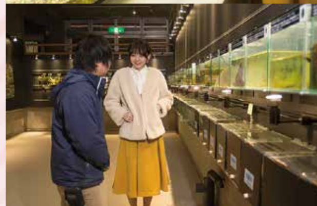
飼育員の方がわかりやすく教えてくれます。

「カワワノのふち」では、絶滅宣言されたニホンカワワノに遺伝的に近い、ユーラシアカワワノを展示。午前10時頃と午後3時頃の給餌時間には、活発に泳ぐ姿が見られ、とても人気です。