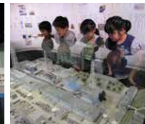
福島第一原子力発電所の模型