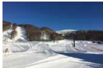
レインボー3500は初級向けの超ロングコース。

ゴンドラで3,500mの初級者向けロングコースを楽しもう! ゲレンデデビューは雪いっぱいのグランデコでロングコースにチャレンジ! グランデコは標高が高いので、転んでも痛くないふわふわの雪質で、楽々上達・笑顔がいっぱいです。ゴンドラと4人乗りの高速リフトに乗りながら、みんなでワイワイ楽しみましょう!