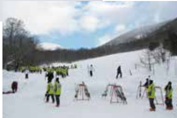
貸切もできるので引率の先生にも安心。