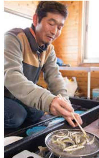
釣ったワカサギはその場で網焼きに。自分で釣ったワカサギの味は格別です。(天ぷらや唐揚げなど、湖上での油の使用は禁止されているため素焼きにしています。)