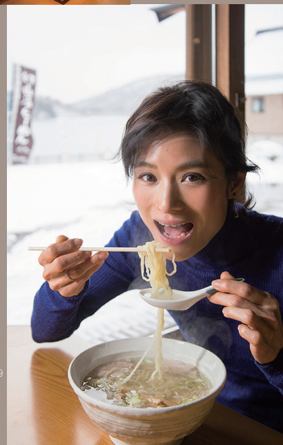
看板メニューの「会津山塩ラーメン」。飲み干せるほど優しくおいしいスープ。

「会津山塩」を使用した塩らあめんが提供され、人気を博しています。日の光にさらさら輝くほど透明なスープは、濃厚なうまみを感じながらもあっさりとしたあどくちで、気が付けば最後の一滴まで飲み干してしまうほどです。