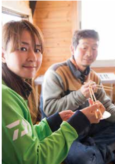
網焼きのワカサギはお醤油で、とっても香ばしい。