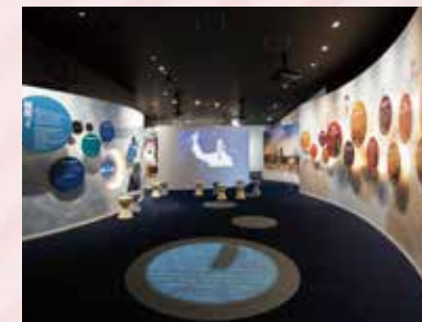
不思議な細菌の世界をクイズや映像でわかりやすく紹介。