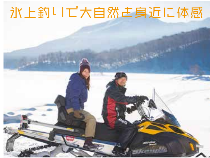
釣り場まではスノーモービルでひっそり飛び。