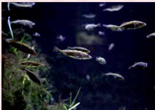
トヨなど福島県の希少な淡水生物を展示しています。