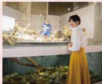
カワワノの餌を食べるかわいい姿に癒されます。