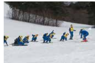
立ち方、転び方など、安全面も考慮し丁寧にレッスンいたします。