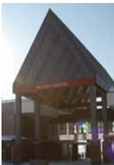
充実のリゾートセンターも魅力的。