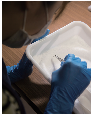
異物が混入していないか、目視でチェックしてピンセットで除去。気の遠くなるような作業