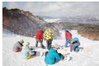
山頂より裏磐梯の景色が一望できます。