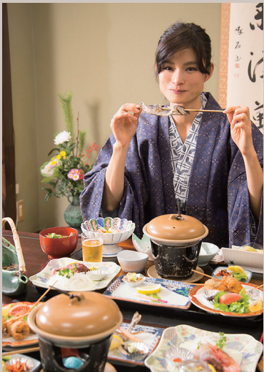
米澤屋のお夕飯。地元食材と「会津山塩」のコラボレーションが味わえる。