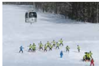
レッスン開始初めてでも安心です。