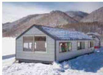
このドーム船は定員14人。他にも様々な大きさのドーム船があります。