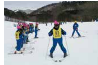
15人程度のクラス編成で、基本からしっかりレッスンいたします。

毎年、県内外から学校様のスキー旅行の実績があり、シーズン中スキー教室で来場される生徒様は約4000名です。初級中級者様向けのゲレンデのため安心して、集合場所が1か所のためとても便利です。レストランは大人数でも収容可能!湧出量が毎分1万リットルの沼尻・中ノ沢温泉からのアクセスも良い立地です。