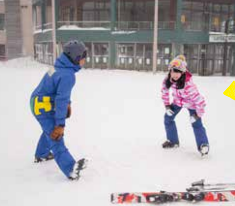
STEP 2 準備運動

バラエティに富んだ29コースを持つスノーリゾート。スキーを体験してくれたのは、双子ダンスがSNSで話題となったまこみなのお子さん。スキーは小学生の時に3回くらいやっただけで10年ぶりとのことでしたが、インストラクターの方に教えていただくとおつという間に上達。いざグリーンデハ!