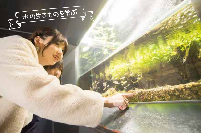
日常生活では出会えない生き物たち。新鮮な驚きと感動があります。