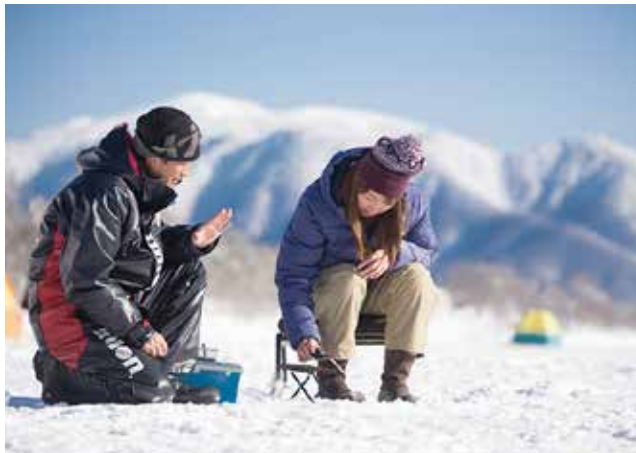
わかりやすく指導してくれるので、ビギナーでも安心です。

いよいよ ワカサギ釣りに挑戦！ 仕掛けをセットしたら餌をつけて湖底へ糸を垂らします。リールは小型で持ちやすく、電動のため簡単です。訪れたのは1月下旬。この時期のワカサギは湖底近くにいるため、オモリが着底したらロック。仕掛けを揺らしてワカサギを誘います。