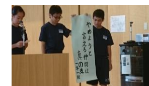
【いじめ撲滅全校集会】