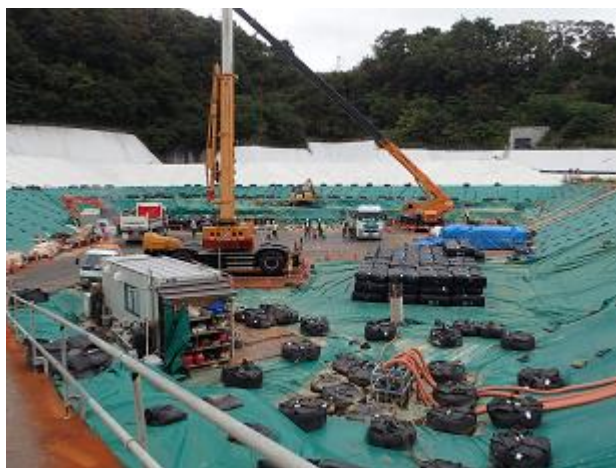
上流側埋立地の埋立状況の確認