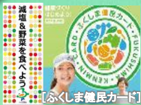
【ふくしま健民カード】