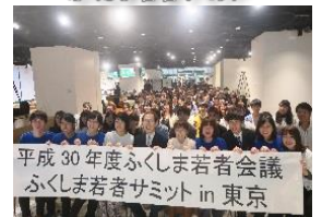
ふくしま若者サミット

高校卒業時から大学在学中にかけて継続的に情報を発信するほか、合同企業説明会の開催やインターンシップの促進等により、若者の県内定着及び県外からの還流を促進。