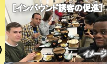
【インバウンド誘客の促進】