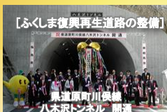
【ふくしま復興再生道路の整備】