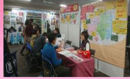
【定住・二地域居住の推進】

人口減少対策を目的として策定した「ふくしま創生総合戦略～ふくしま7つの挑戦～」については次項を参照。