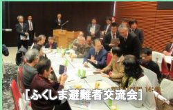
【ふくしま避難者交流会】