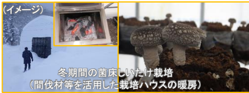
冬期間の菌床しいたけ栽培 (間伐材等を活用した栽培ハウスの暖房)

豊富な森林資源を活用した冬期間の生産体系の確立や、移住者を雇用する取組を支援することにより、農と林が有する資源の好循環と移住者の就労機会の創出を促進。