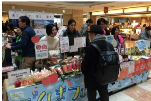
ふくしまフェスタ in 羽田空港

風評の払拭や風化の防止を図るため、市町村、国、民間企業及び関係部局等との共働により、復興の歩みを進める 本県の姿や食と観光・ 県産品等の魅力を 国内外に向けて発信。