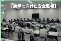
【廃炉に向けた安全監視】