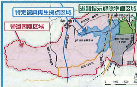
広域図 (双葉町全域)