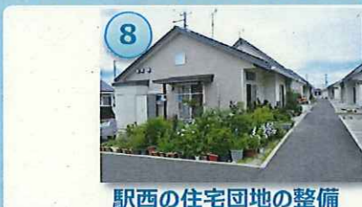
駅西の住宅団地の整備

「新たな産業・雇用の場」と連携した 「新たな生活の場」の確保・「既成市街地の再生」