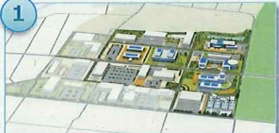
中野の産業団地の整備