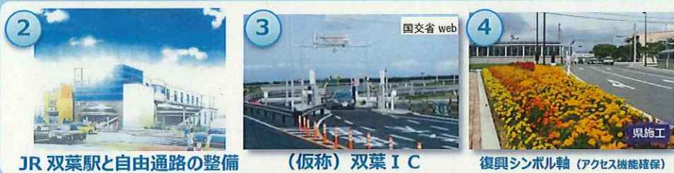
JR 双葉駅と自由通路の整備 (仮称) 双葉 I C 復興シンボル軸 (アクセス機能確保)