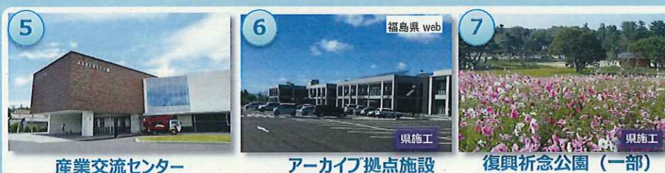
産業交流センター アーカイブ拠点施設 復興祈念公園 (一部)