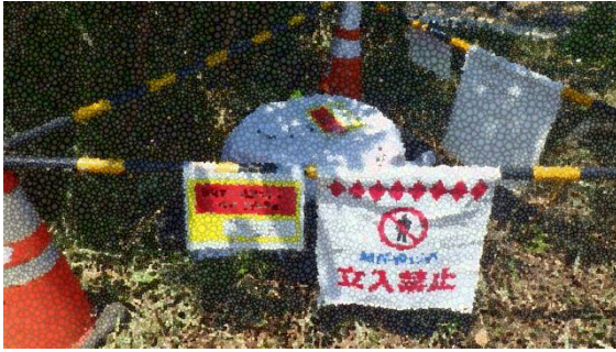
(写真1-2) シート養生及び立入禁止措置