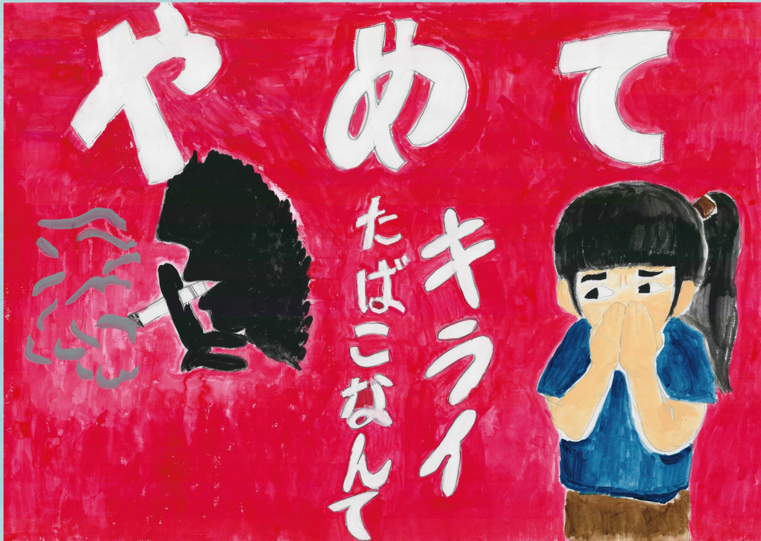
平成 30 年度ジュニア受動喫煙防止ポスターコンクール最優秀賞受賞作品