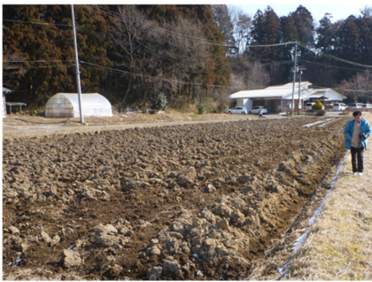
プラウ及びプラソイラによる 土壌の凍結乾燥 (H31. 1. 30)

本年度は、平成 30 年度に発生の多かった「ノビエ」と「クログワイ」対策のため、「冬期間の水田乾燥化」に加えて「早期代かき（2 回代かき）」と「機械除草」を組み合わせた体系的な防除技術の実証を行います。