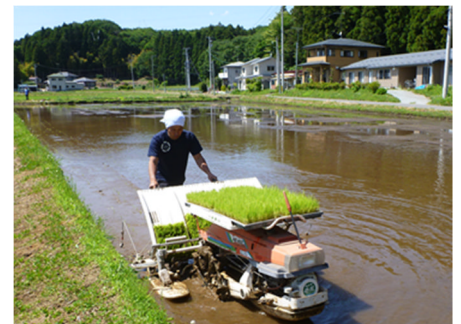
代かき (5/28 実施) 後の 田植え (R 元. 5. 30)