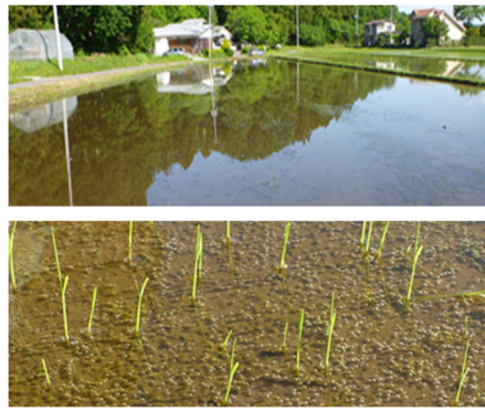
代かき (5/7 実施) 後 16 日目に ノビエが大量発生 (R 元. 5. 23)