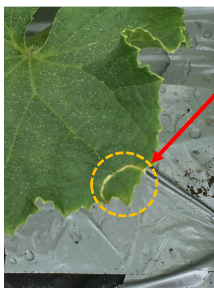
ウリハムシによる食害葉 (R元. 6. 10)