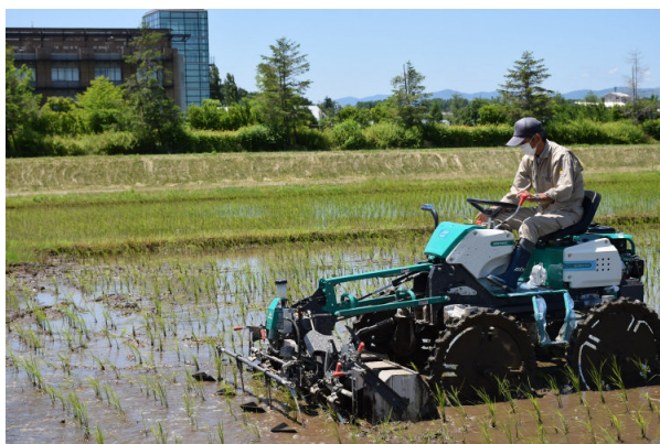
ウィードマンによる除草実施 (R元. 6. 13)

この除草機は、「環境にやさしい農業推進事業」を活用して県内の有機農業者にも導入が進んでいます。作業部が前方にあり、条間除草に加えて株間も回転式レーキで行うなどの特徴を備えています。有機農業推進室では5月23日に水稲有機栽培試験田の田植えを行い、6月3日、6月13日の2回、本機を用いて除草を行いました。本年は、試験田に稲わらのみを投入し、冬期間の水田乾燥化による抑草と機械除草を組み合わせることで安定した収量を確保する技術の実証を進めています。また、センター本部以外でもこの除草機の現地実証を浜通り（南相馬市小高区、富岡町）と会津地方（磐梯町）で行いました。