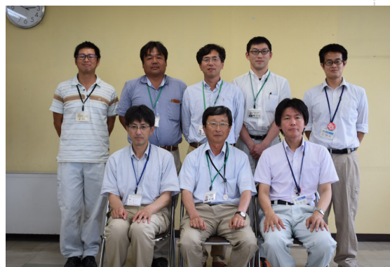
職員一同です。よろしくお願ひします。