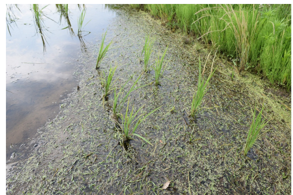
機械除草によって浮いた雑草 (R元. 6. 20)