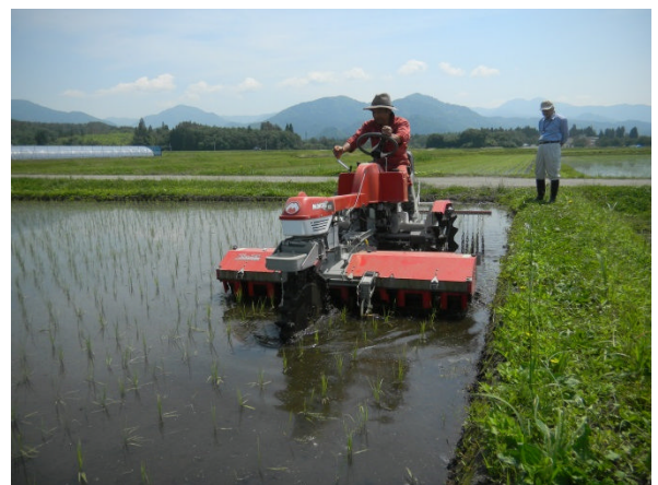
乗用型水田除草機による除草作業 (R 元. 5. 30)

※酒粕米ぬかペレット：米ぬかに酒粕を 20 % 混合して水分を調整し、ペレット化したもの。