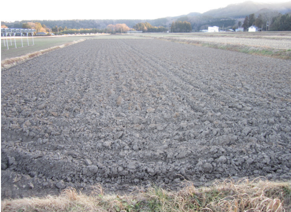
反転耕を実施したほ場 (H31. 1. 9)

また、屑大豆散布と機械除草の組合せ処理による除草効果の安定性を昨年と同じく実証することとしています。