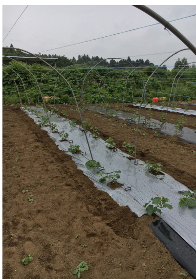
実証ほのシルバーマルチ設置区 (R元. 6. 6)

ほ場にシルバーマルチと黒マルチを貼った区を設置し、ウリハムシによる葉の加害数等を調査し、防除効果の実証を行います。