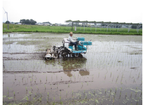
除草作業の実施 (R元. 6. 5)