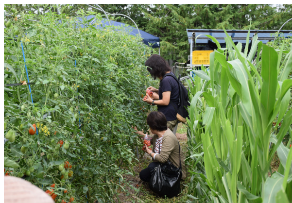
昨年度のトマト収穫体験 (H30.9.7)