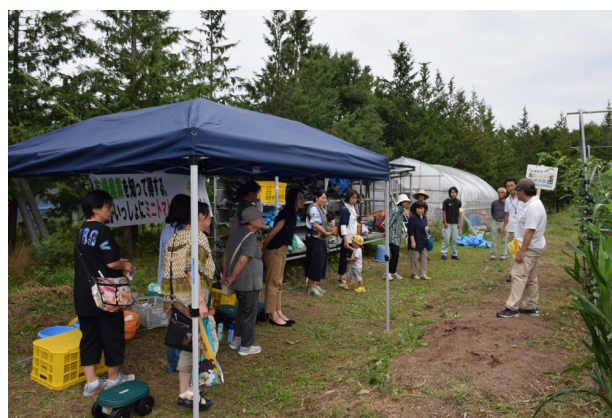
有機栽培ほ場での説明会 (H30.9.7)