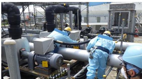
(写真2) 排水開始後の配管系統等の確認状況