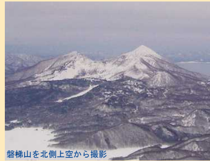
磐梯山を北側上空から撮影