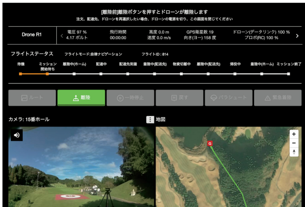
ドローンダッシュボード