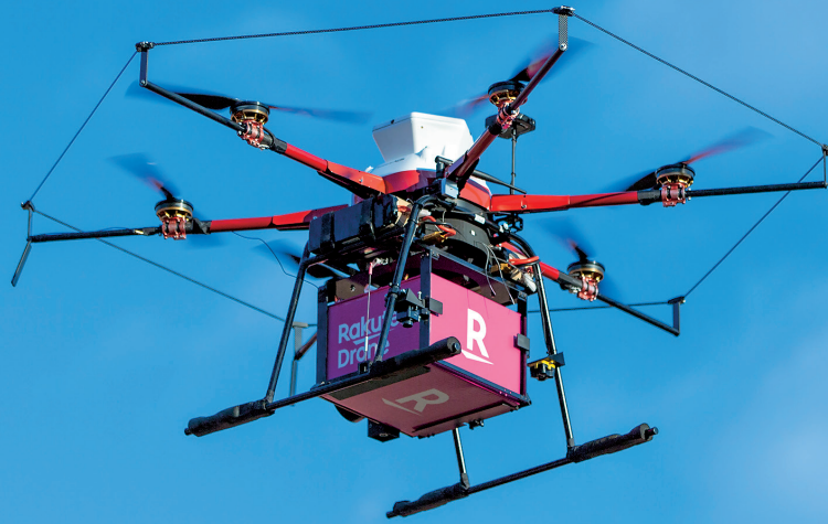
物流専用ドローン「天空」