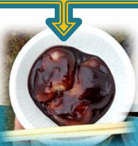
豚汁等が 振る舞われた