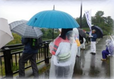
阿賀川河岸の地層(遠望)