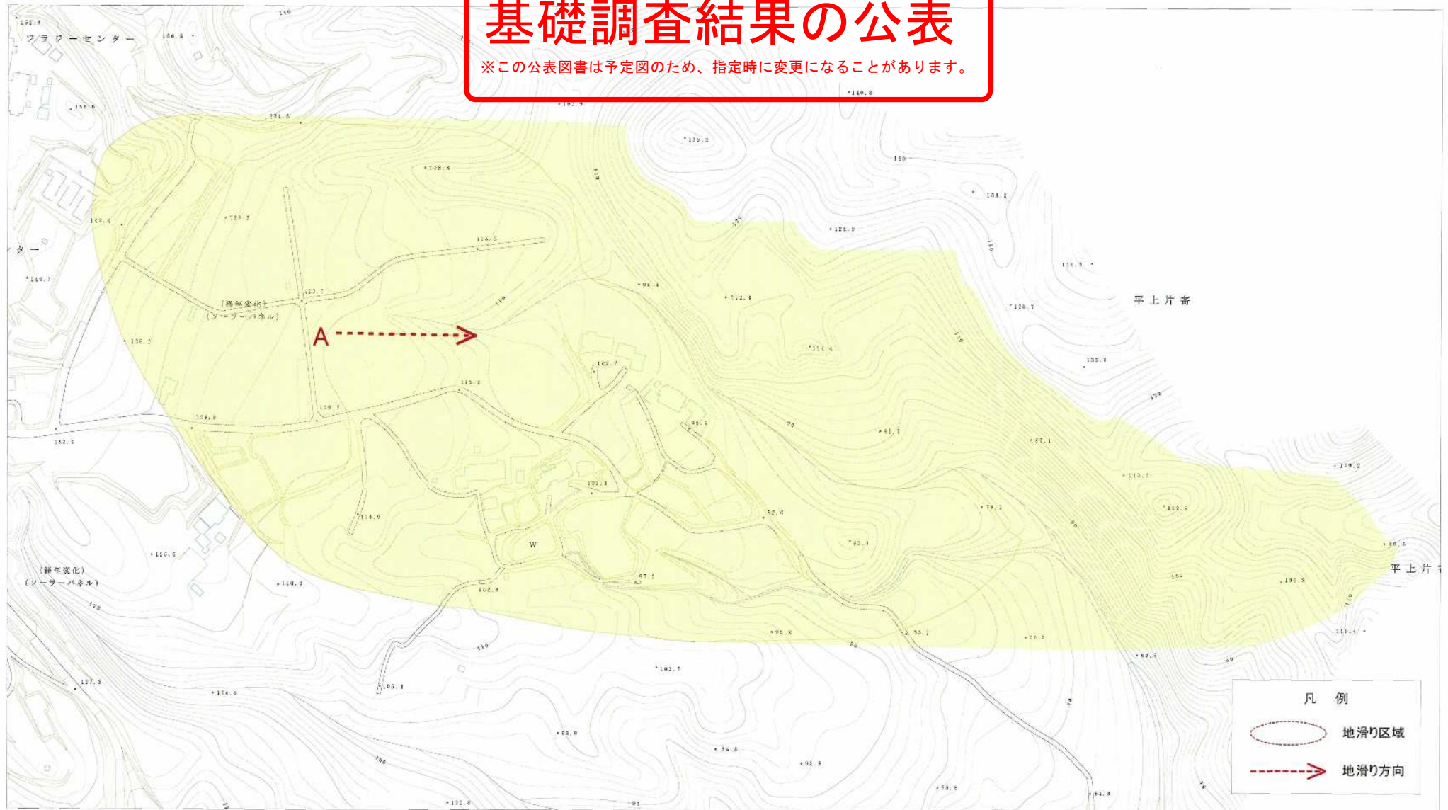
様式-2(地) 土砂災害警戒区域・土砂災害特別警戒区域 区域図