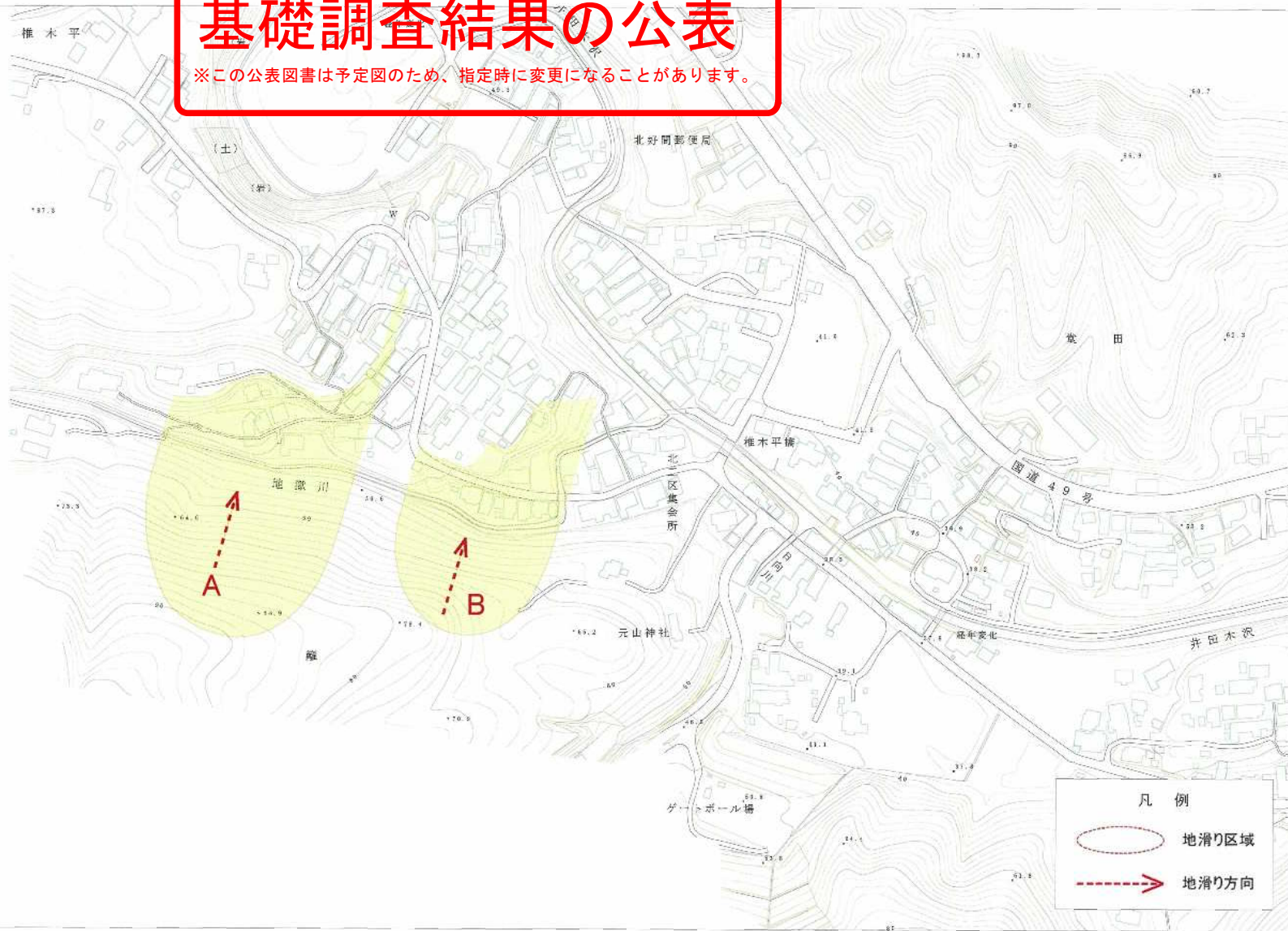
様式-2(地) 土砂災害警戒区域・土砂災害特別警戒区域 区域図