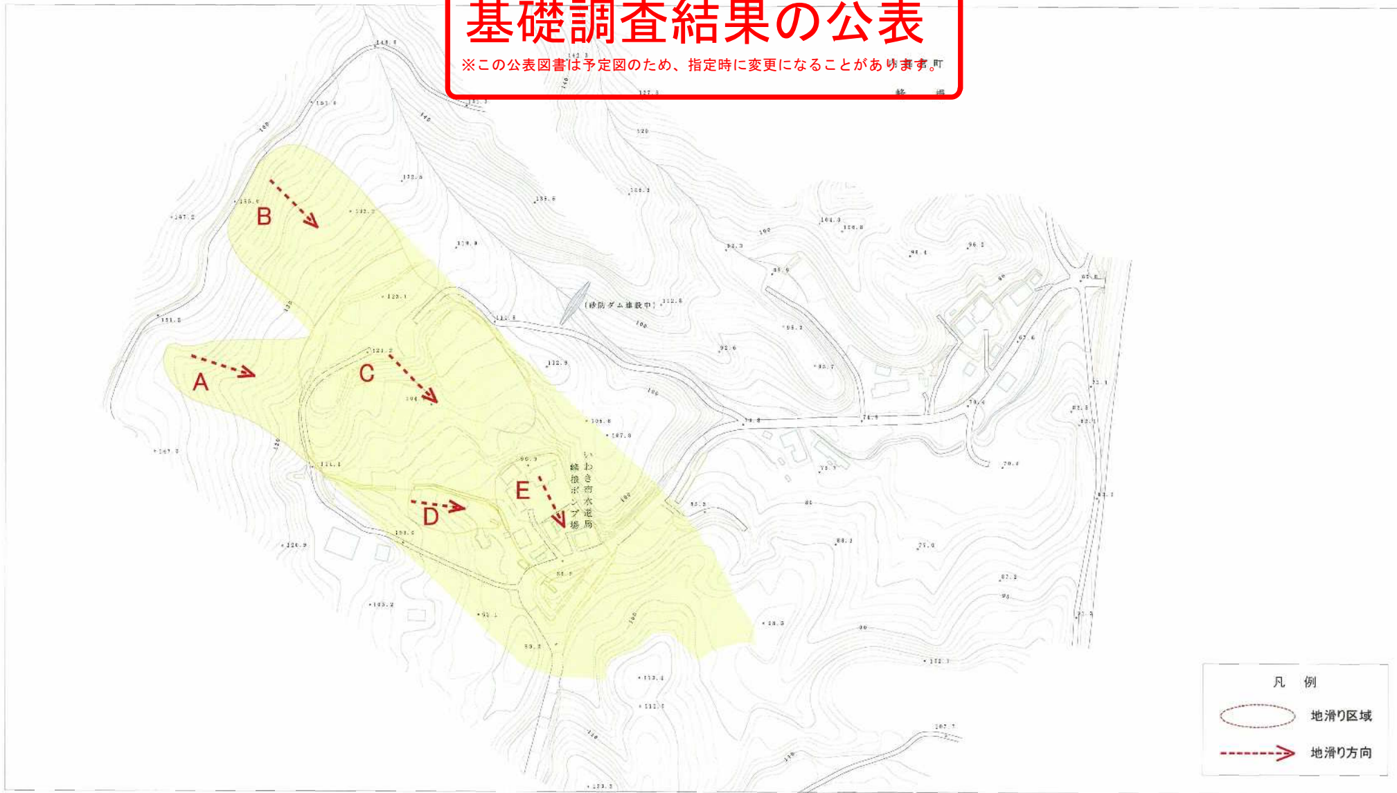
様式-2(地) 土砂災害警戒区域・土砂災害特別警戒区域 区域図