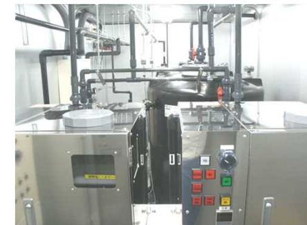
アルカリ水・次亜塩素酸水 洗浄シンク写真