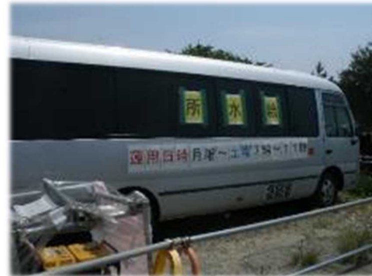
移動式給水車イメージ