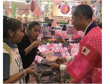
タイでのプロモーション