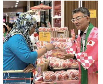
マレーシアでのプロモーション