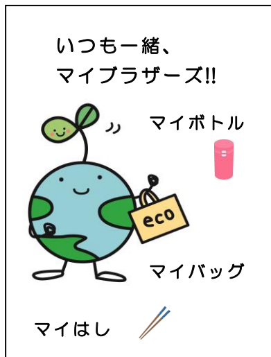
< 表面 >