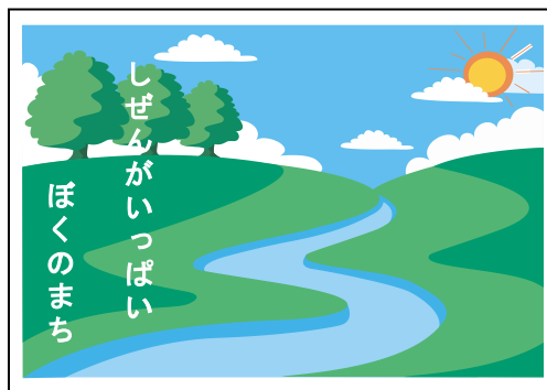
< 表面 >