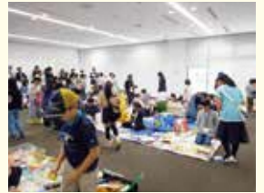
MOTTAINAIキッズフリーマーケット