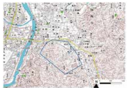
イノシシの行動圏の一例

これまで、避難指示区域内のイノシシの行動圏が、避難指示区域外のそれと比べて、拡大する傾向が見られること等が明らかになっています。