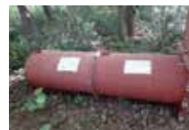
クマ捕獲用トラップ