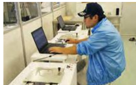
CsIやNaIシンチレーション検出器で検査 (小名浜魚市場検査室)