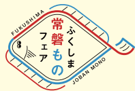
相馬原釜地方卸売市場（松川浦漁港）