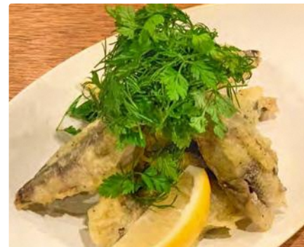
福島県産 メヒカリの香草香るフリット