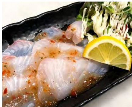
福島県産 天然ヒラメのカルパッチョ

【住所】 東京都江東区大島5-8-7 長沼ビル101 ■都営新宿線大島駅A1出口徒歩30秒