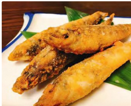
福島県産 メヒカリの唐揚げ

【住所】千葉県千葉市中央区新宿2-2-2 第三プレシードビル2F ■京成千葉中央駅徒歩1分