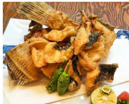
福島県産 鰯の唐揚げ