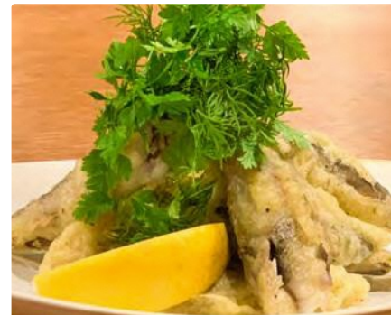
福島県産 メヒカリの香草香るフリット