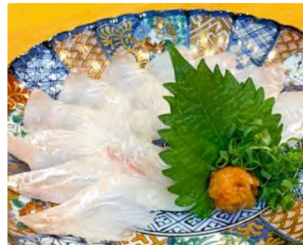
福島県産 ひらめうす造り