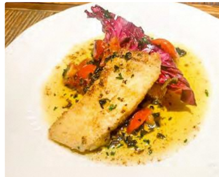
福島県産 ヒラメのムニエル

【住所】神奈川県横浜市港北区 綱島西 1-9-7 ヒカリヤビル1F ■東急東横線綱島駅徒歩3分