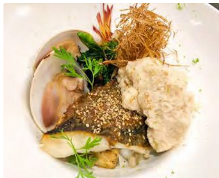
福島県産ヒラメのボワレ 貝だしと和だしの泡ソース