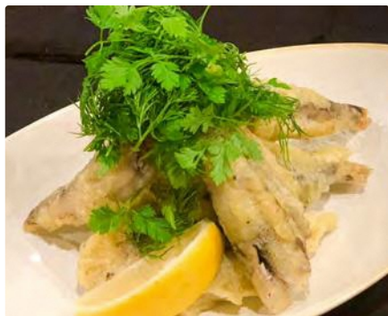
福島県産 メヒカリの香草香るフリット

■住所 東京都千代田区丸の内1-9-1 東京駅一番街2F 東京グルメゾン H-1 ■東京駅八重洲北口から直結