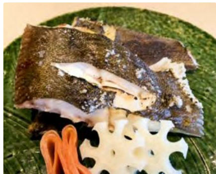
福島県産 マコガレイの塩焼き