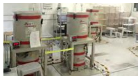
Ge半導体検出器で検査 (福島県農業総合センター検査室)