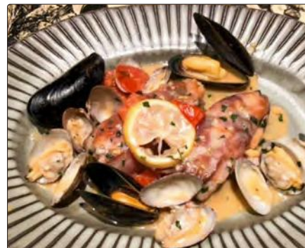
福島県産 ヒラメのサルティンポッカ