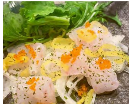
福島県産スモークイカ平目とたくあんのカルパッチョ