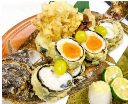
福島県産 カレイの擦々揚げ