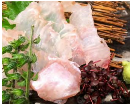
福島県産 天然ヒラメの昆布締め