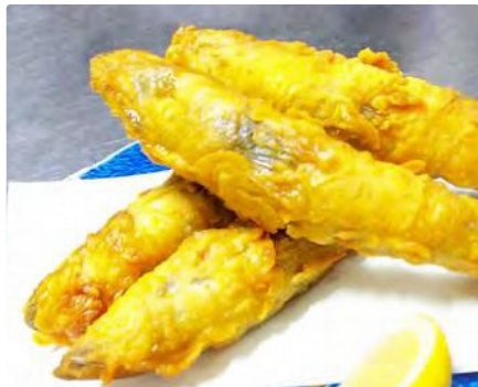
福島県産 丸々太ったメヒカリの唐揚

【住所】神奈川県横浜市戸塚区品濃町550-7 広進ビル2F ■JR横須賀線東戸塚駅徒歩4分