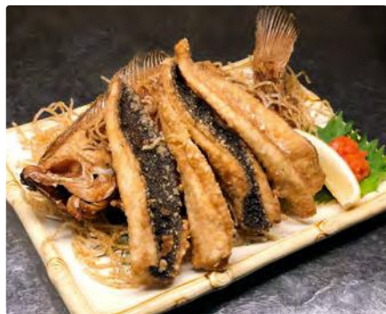
福島県産 カレイ姿揚げ