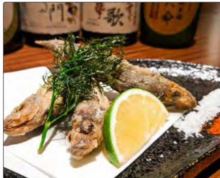
福島県産 目玉唐揚げ

【住所】東京都中央区銀座6-7-6 ラベビルB1F ■地下鉄銀座駅B5出口から徒歩3分