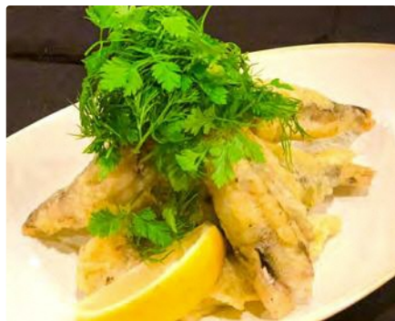
福島県産 メヒカリの香草香るフリット