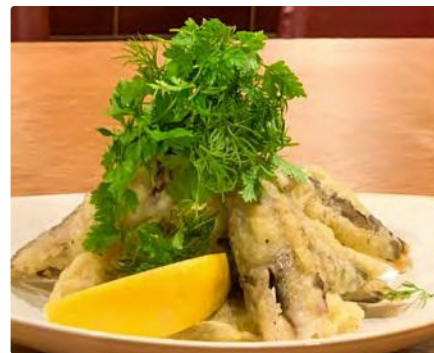
福島県産 メヒカリの香草香るフリット