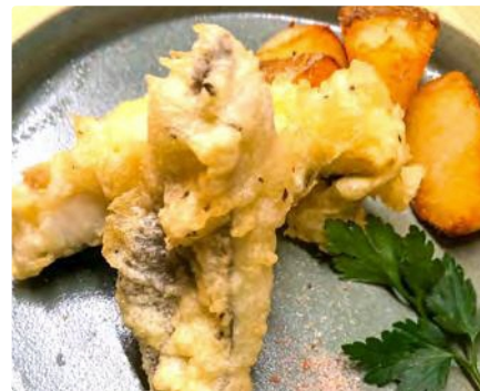
福島県産 ヒラメのフィッシュ&チップス

【住所】 東京都渋谷区恵比寿西2-21-15 代官山ポケットパーク102 ■東急東横線 代官山駅から20m 徒歩30秒