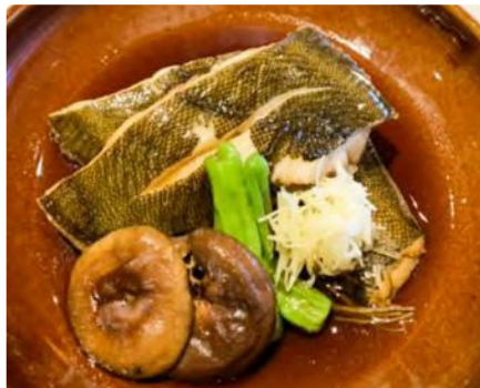
福島県産 マコガレイの煮付け

■住所 東京都世田谷区奥沢5-42-3 トレインチ自由が丘A102 ■自由が丘駅から徒歩2分