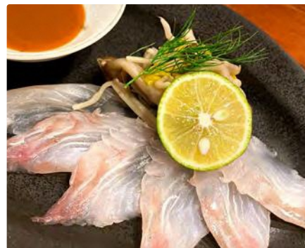
福島県産ヒラメ ウニソースがけ

■住所 東京都中央区銀座8-6-11 新和ビル5F ■新橋駅から279m銀座方面へガードをくぐり、ホテルコムズの裏横断のビル5階になります。