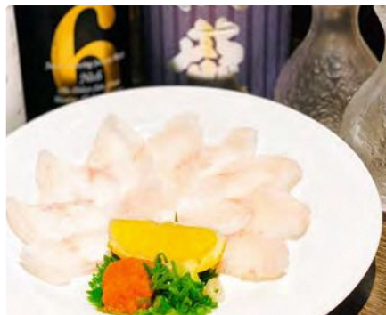
福島県産 平目の薄造り

【住所】 東京都港区赤坂3-9-4 赤坂扇やビルB1F ■赤坂見附駅から徒歩59m