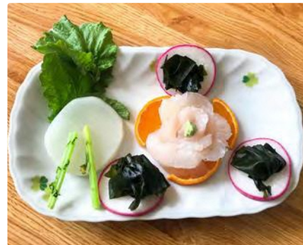
福島県産ヒラメ、福島産大根を使った復興応援刺身盛り合せ