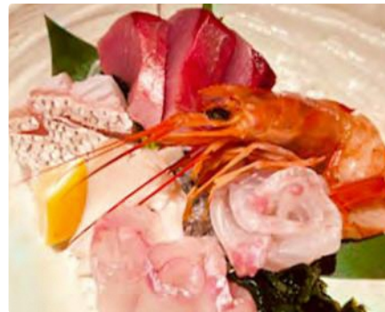
福島県産 鮮魚の盛合せ

【住所】神奈川県横浜市港北区日吉本町1-4-25 ■東急東横線・目黒線日吉駅西口徒歩3分 ■横浜市営地下鉄日吉2番出口徒歩3分