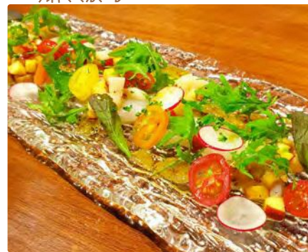
福島県産 ヒラメと魚介とリンゴのタルタル添え

【住所】 東京都渋谷区神宮前5-52-2 青山オーバルビル B1F ■東京メトロ表参道駅B2出口より徒歩3分 ■JR渋谷駅東口徒歩9分