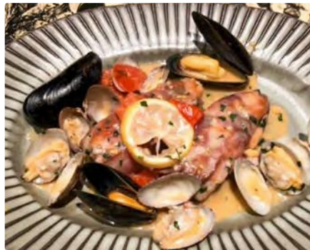
福島県産 ヒラメのサルティンボッカ