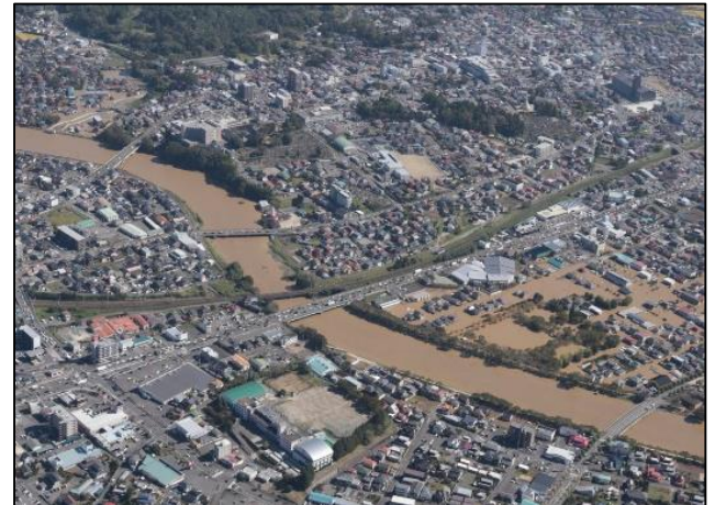
須賀川市内浸水状況