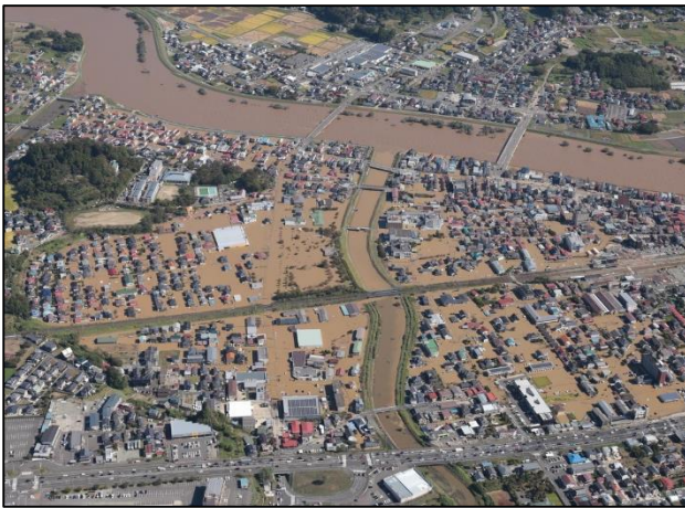
本宮市内浸水状況