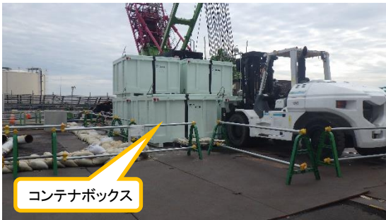
(写真3) コンテナボックスの仮置き状況 当該コンテナボックスに切断した主 柱等を収納し、野積み保管場所へ移送 する