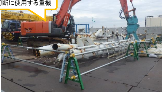
(写真1) 南西側から撮影