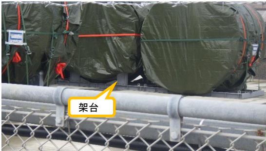
(写真2) 北東側から撮影